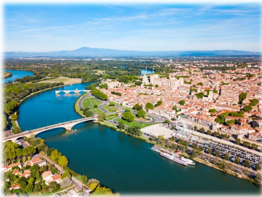
Πανοραμική άποψη της Αβινιόν και του Ροδανού ποταμού που τη διαρέει