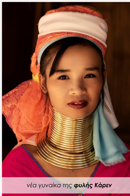
νέα γυναίκα της φυλής Κάρεν