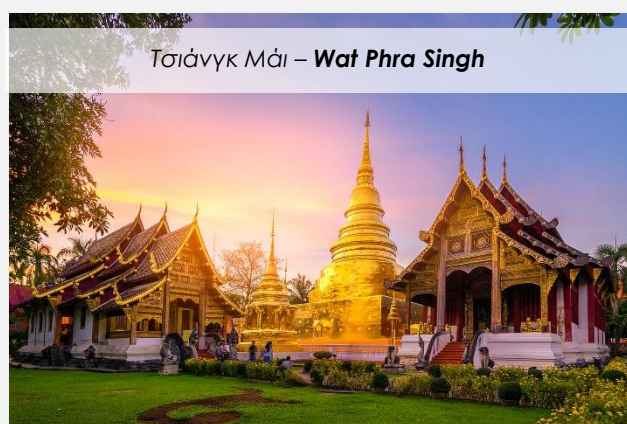
Τσιάνγκ Μάι – Wat Phra Singh