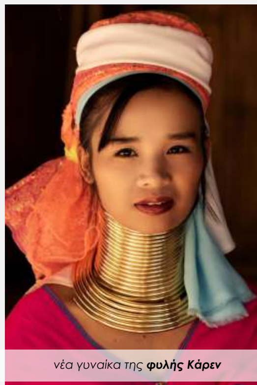
νέα γυναίκα της φυλής Κάρεν