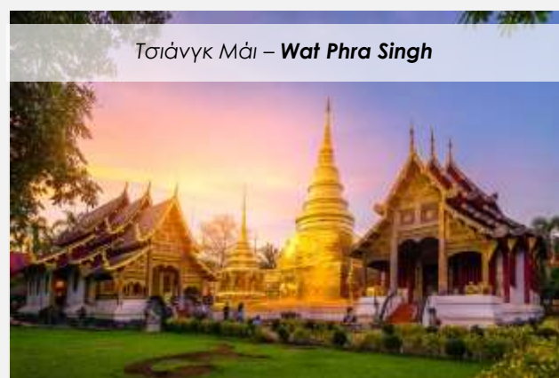
Τσιάνγκ Μάι – Wat Phra Singh