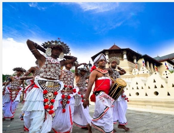
Λαϊκή γιορτή στην Κεϋλάνη