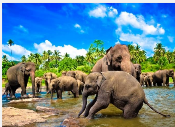
Ελέφαντες στο ποτάμι