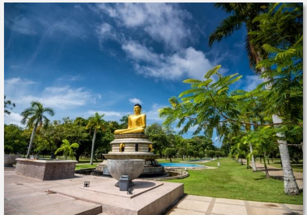
Viharamahadevi Park, Κολόμπο