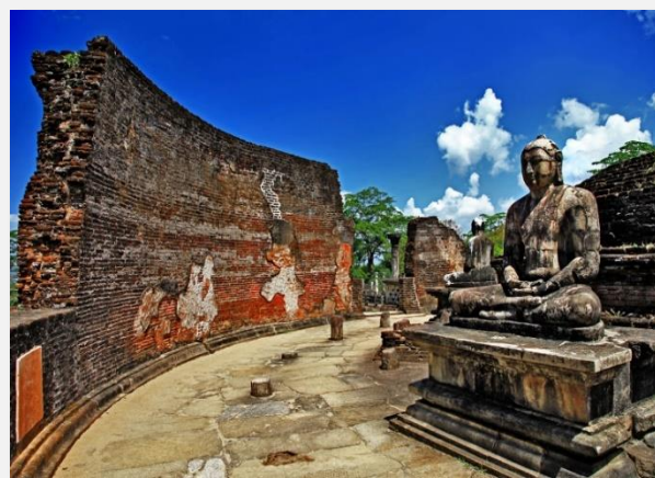
Ο Ναός του Βούδα στην Polonnaruwa