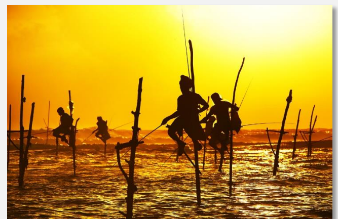
Ψάρεμα με τον πατροπαράδοτο τρόπο