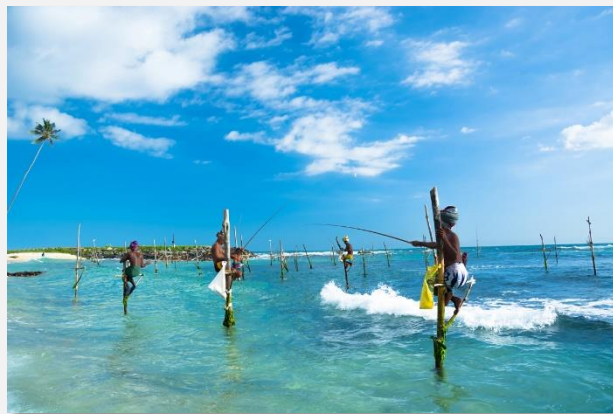
Ψαράδες επί το έργον

Το παραπάνω πρόγραμμα είναι ενδεικτικό. Το τελικό ενημερωτικό αποστέλλεται περίπου 3-5 ημέρες πριν από την εκάστοτε αναχώρηση.