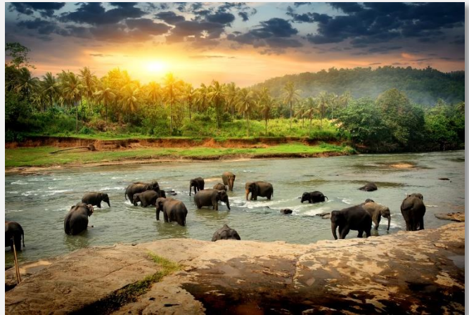
Χαρακτηριστικό τοπίο στη Σρι Λάνκα

Πρωινό και αναχώρηση με προορισμό μας την Μπεντότα, στη δυτική ακτή της Σρι Λάνκα. Η μεγάλη παραλία της Μπεντότα, με τους φοίνικες και τη σιμιγδαλένια άμμο είναι από τις πιο δημοφιλείς καρτ-ποσταλικές εικόνες της Σρι Λάνκα. Άφιξη, μεταφορά και τακτοποίηση στο ξενοδοχείο μας. Διανυκτέρευση.