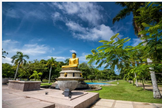
Viharamahadevi Park, Κολόμπο