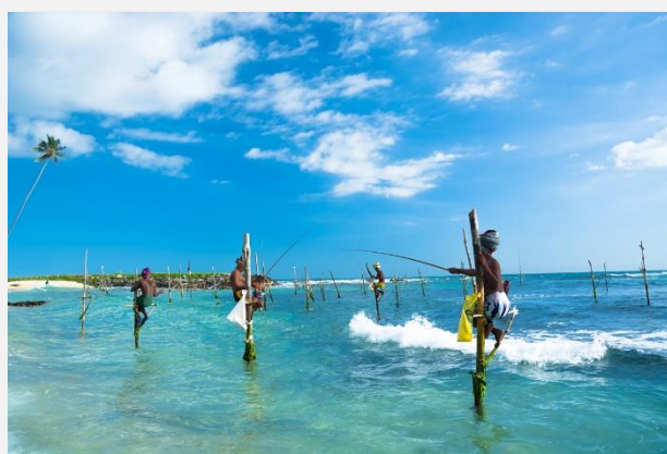
Ψαράδες επί το έργον