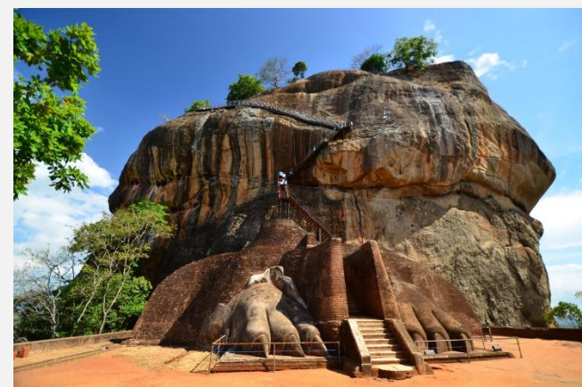
Φρούριο Sigiriya Lion Rock