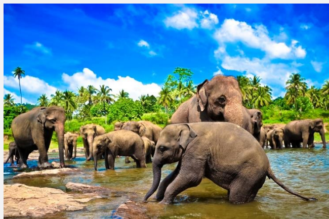
Ελέφαντες στο ποτάμι