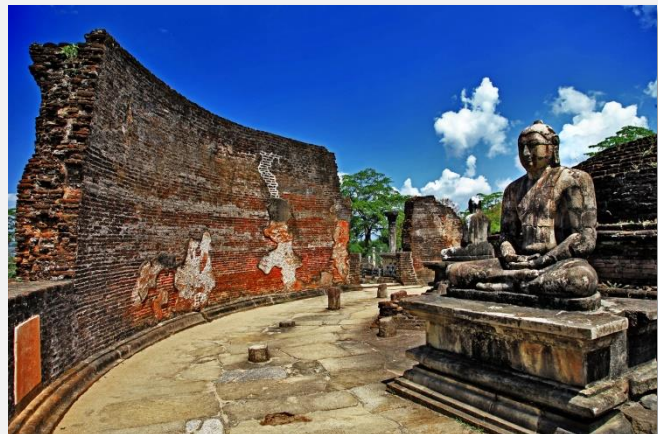
Ο Ναός του Βούδα στην Polonnaruwa