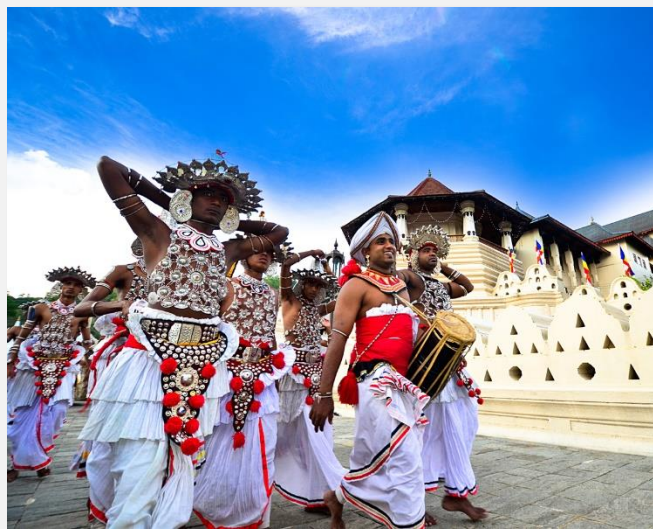
Λαϊκή γιορτή στην Κεϋλάνη

Κατά τη σημερινή μας ημέρα θα επισκεφθούμε τους βοτανικούς κήπους Περαντενίγια (Peradeniya), που αρχικά φυτεύτηκαν προς τέρψιν