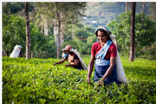
Σε φυτείες τσαγιού