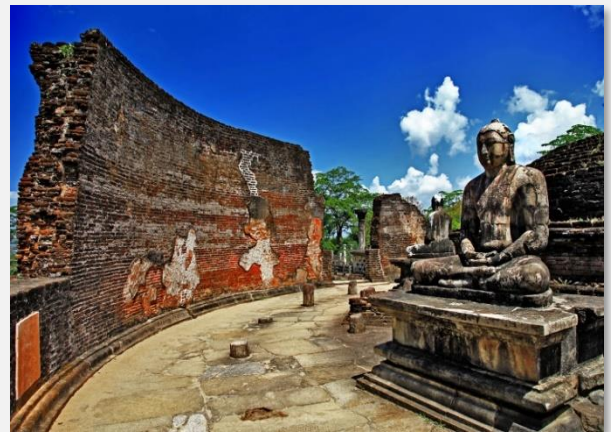
Ο Ναός του Βούδα στην Polonnaruwa