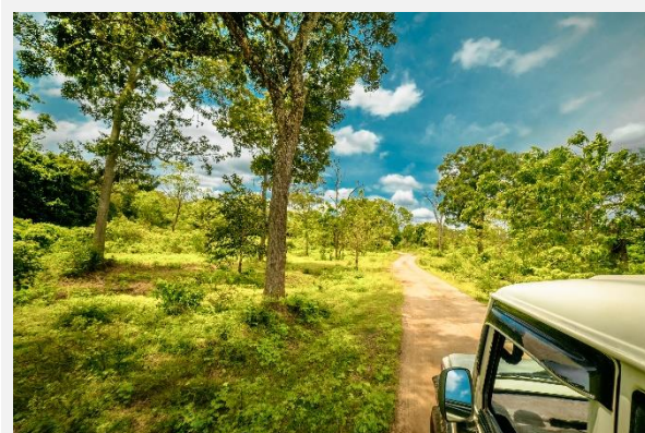
Πάρκο Γιάλα, Σρι Λάνκα