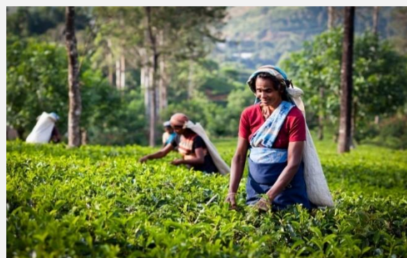
Σε φυτείες τσαγιού