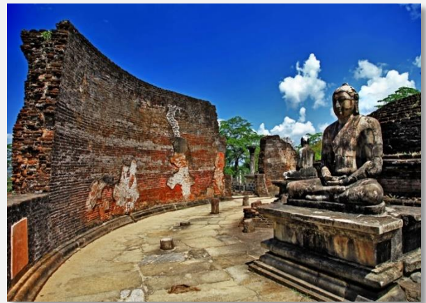
Ο Ναός του Βούδα στην Polonnaruwa