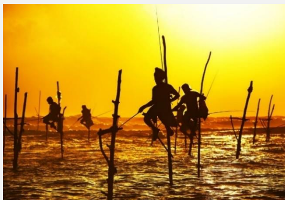
Ψάρεμα με τον πατροπαράδοτο τρόπο