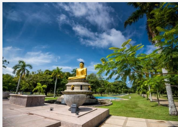
Viharamahadevi Park, Κολόμπο