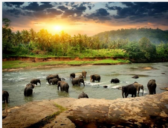
Χαρακτηριστικό τοπίο στη Σρι

Πρωινή αναχώρηση για την πόλη Γκάλε, η οποία θα μας εντυπωσιάσει με το έντονο αποικιακό της χρώμα και την πλούσια ιστορία της, καθώς από την πόλη αυτή πέρασαν διαδοχικά Βρετανοί, Πορτογάλοι και Ολλανδοί. Την προσοχή μας πάντως θα τραβήξει το Φρούριο της πόλης, το οποίο κατασκευάστηκε από τους Πορτογάλους