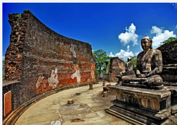
Ο Ναός του Βούδα στην Πολονναρούβα