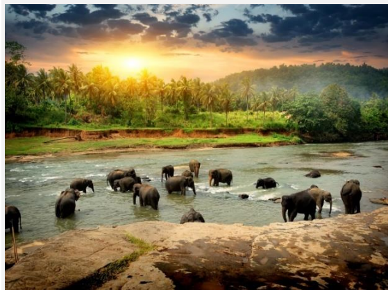
Χαρακτηριστικό τοπίο στη Σρι Λάνκα

Πρωινό στο ξενοδοχείο μας και συνεχίζουμε την εξερεύνηση της Σρι Λάνκα, με κατεύθυνση προς το νότο. Ο δρόμος θα μας φέρει σε λιγότερο γνωστά