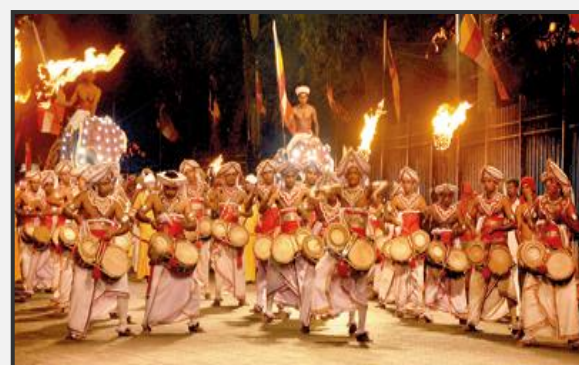
Νυχτερινή παρέλαση στις γιορτές