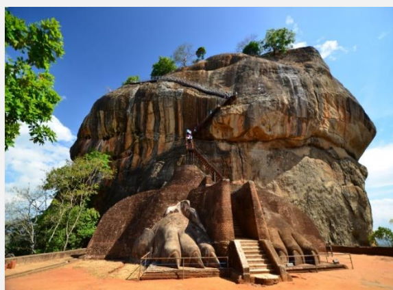
Φρούριο Sigiriya Lion Rock