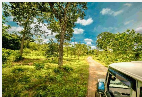
Σαφάρι Εθνικό Πάρκο Γιάλα