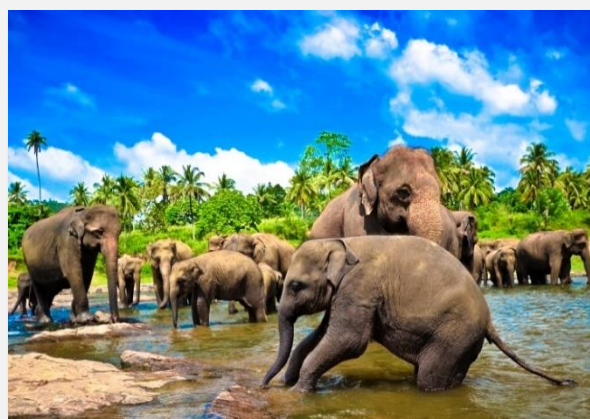
Ελέφαντες στο ποτάμι