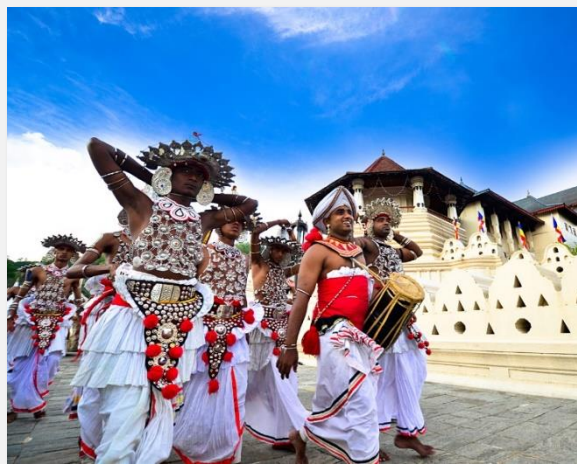
Λαϊκή γιορτή στην Κεϋλάνη

Χτισμένη σε υψόμετρο περίπου 500 μέτρων και μέσα σε ένα καταπράσινο τοπίο με φυτείες τσαγιού, η Κάντυ ξεχωρίζει για τον πολιτιστικό και φυσικό της πλούτο. Για σήμερα σας προτείνουμε να κάνετε τις βόλτες σας ή και μια βαρκάδα στην πανέμορφη λίμνη που αποτελεί πνεύμονα