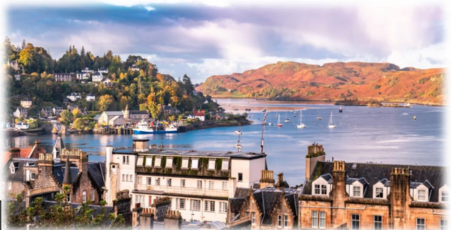
Παραθαλάσσια πόλη Όμπαν

Άφιξη στο πολύβουο λιμάνι του Όμπαν, γνωστό ως «πύλη των νησιών», χτισμένο στον ομώνυμο όρμο του Ατλαντικού, από όπου πήρε και το όνομά του. Αποκαλείται επίσης και «πρωτεύουσα της ψαροφαγίας στη Σκωτία», λόγω των πλούσιων αλιευμάτων που σερβίρονται στις ταβέρνες του! Τακτοποίηση στο ξενοδοχείο μας. Διανυκτέρευση.