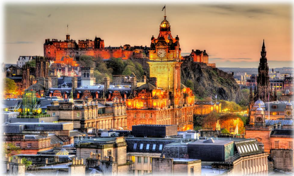
Η νέα πόλη του Ενδιβούργου με το κάστρο της

Η πρωινή μας βόλτα θα ξεκινήσει από το Γεωργιανό τμήμα της πόλης, που άρχισε να κτίζεται στα μέσα του 18ου αιώνα. Θα δούμε υπέροχες πλατείες, μεγάλους δρόμους και ιστορικά κτίρια, που διατηρούν μέχρι σήμερα τη μεγαλοπρέπειά τους. Συνεχίζοντας, θα ανεβούμε στον λόφο Calton, όπου βρίσκεται το μνημείο του Νέλσωνα και ο ημιτελής Παρθενώνας. Από την κορυφή του λόφου θα απολαύσουμε την πανοραμική θέα της πόλης. Στη συνέχεια θα περάσουμε από το ιστορικό παλάτι του Χόλιρουντ - την επίσημη κατοικία της Βασιλικής οικογένειας, που το χρησιμοποιεί ως κατοικία όταν επισκέπτεται την Σκωτία. Δια μέσου του Royal Mile - του Βασιλικού Μιλίου - θα διασχίσουμε την παλιά πόλη του Εδιμβούργου, βλέποντας το Τόλμπουθ (Tolbooth), το σπίτι του Τζον Νοξ και την παλιά αγορά Grass Market στους πρόποδες του πύργου. Στο τέλος της ξενάγησής μας θα σταματήσουμε για επίσκεψη στο ιστορικό κάστρο του Εδιμβούργου (προαιρετική είσοδος). Εδώ εκτίθενται "τα κοσμήματα του στέμματος" δηλαδή, το Στέμμα, το Σπαθί, το Βασιλικό Σκήπτρο, όπως και η Θρυλική Λίθος του Stone ή Λίθος του πεπρωμένου. Θα δούμε επίσης το μικρό παρεκκλήσι της Αγίας Μαργαρίτας (900 ετών) και το Μαουσωλείο των Σκωτσέζων πεσόντων στρατιωτών. Απόγευμα ελεύθερο για βόλτες στην υπέροχη πόλη. Επιστροφή στο ξενοδοχείο μας. Το βράδυ μπορείτε να συμμετάσχετε (προαιρετικά) σε μία Σκωτσέζικη βραδιά με παραδοσιακούς χορούς. Διανυκτέρευση.