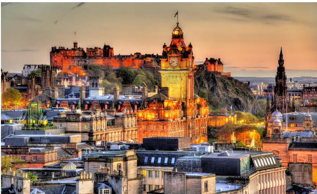
Η νέα πόλη του Ενδιβούργου με το κάστρο της

Εν συνεχεία διανυκτερεύουμε στη γραφική και πανέμορφη πόλη Όμπαν, η οποία θα αποτελέσει και το ορμητήριό μας για να επισκεφτούμε τα Χάιλαντς και τις άλλες φυσικές ομορφιές της Σκωτίας. Το Όμπαν φημίζεται για το μοναδικό ουίσκι, τα λαχταριστά θαλασσινά αλλά και τους εντυπωσιακούς πύργους του. Από κει θα πάμε ως το Αβιμόρ για να θαυμάσουμε και τις περίφημες λίμνες της Σκωτίας – ναι και τη Λοχ Νες... Και μετά θα πλεύσουμε για το Νησί Μαλ με τα σκωτσέζικα φιόρδ, τις λίμνες και τα εκπληκτικά τοπία. Μεταξύ άλλων θα προσπαθήσουμε να λύσουμε το μυστήριο του περίφημου κύκλου μεγάλιθων του Λοχμπουί... Ίσως το πνεύμα του κυρίου Σέρλοκ μας βοηθήσει!