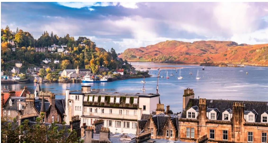
Παραθαλάσσια πόλη Όμπαν