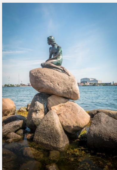
Μικρή Γοργόνα, Κοπεγχάγη