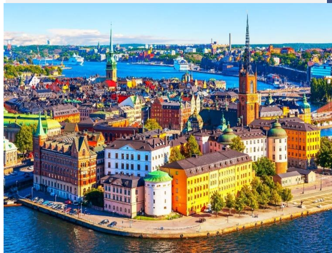
Παλιά Πόλη, Στοκχόλμη

Πρωινή αναχώρηση για την δυτική πλευρά της χώρας, στη χερσόνησο Σιέλαντς Οντ με το ομώνυμο λιμάνι, περνώντας έξω από την Ροσκιλντε, πόλη με πλούσια ιστορία, η οποία ανάγεται από την προχριστιανική εποχή των Βίκινγκς. Επιβίβαση στο φέρρυ που θα μας μεταφέρει στο ατμοσφαιρικό Άαρχους την "rocket city", όπως αποκαλούν οι Δανοί την δεύτερη μεγαλύτερη πόλη και σημαντικό εμπορικό λιμάνι της χώρας, καθώς τα πάντα εκεί είναι κοντά. Το Άαρχους (Århus, προφέρεται Όρχους) βρίσκεται στην χερσόνησο της Γιουτλάνδης και προσφέρει πολλές επιλογές διασκέδασης και μοναδικούς χώρους τέχνης. Άφιξη και πανοραμική περιήγηση στην πόλη. Τακτοποίηση στο ξενοδοχείο μας. Διανυκτέρευση.