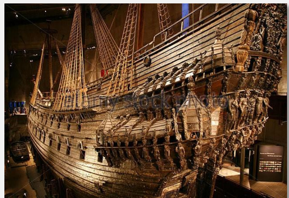
Μουσείο Βάσα, Στοκχόλμη

Το παραπάνω πρόγραμμα είναι ενδεικτικό Το τελικό ενημερωτικό αποστέλλεται περίπου 3-5 ημέρες πριν από την εκάστοτε αναχώρηση.