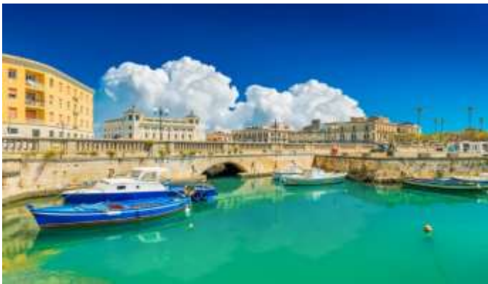
Άποψη της Ορτυγίας από το λιμάνι

στεγάζεται σε ένα παλάτι του 13ου αιώνα. Στις σύγχρονες ατραξιόν του νησιού συγκαταλέγεται η τοπική αγορά στους πάγκους, όπου μπορεί κανείς να δοκιμάσει τοπικές θαλασσινές νοστιμιές και σνακ όπως είναι τα «αραντσίνι» (παναρισμένες κροκέτες ρυζιού) και τα «κανόλι» (επιδόρπιο με φύλλα ζύμης, ρικότα και κρέμα).