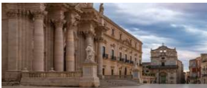
Η πανέμορφη μαρμάρινη κεντρική πλατεία της Ορτυγίας

Φυσικά στην Ορτυγία υπάρχουν πολλά αρχαιολογικά ευρήματα, οι ναοί της Αθηνάς, και το σημαντικό Μουσείο Μεσαιωνικής Τέχνης που