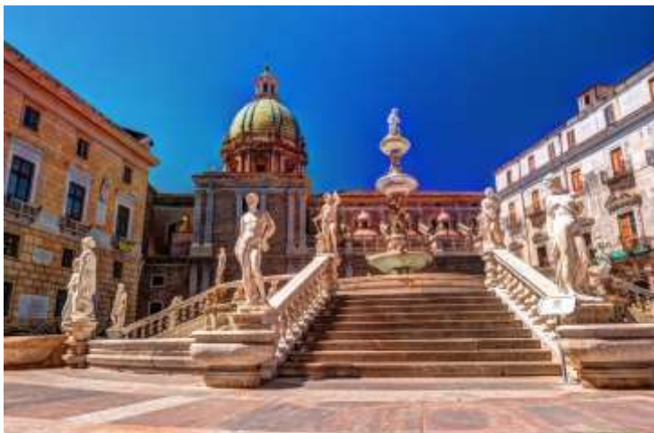
Το διάσημο «Σιντριβάνι της Ντροπής» στο Παλέρμο, στην μπαρόκ πλατεία Πρετορία. Την ονομασία του πήρε εξαιτίας των γυμνών αγαλμάτων που το περιστοιχίζουν.