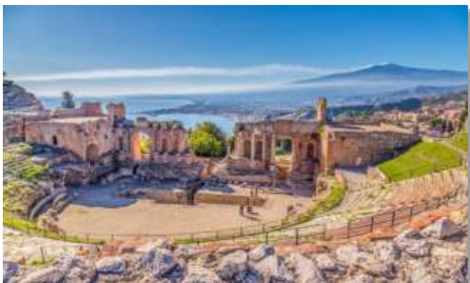
Αρχαίο ελληνικό θέατρο στην Ταορμίνα της Σικελίας. Στο βάθος φαίνεται καπνός από το ηφαιστειο της Αίτνας.