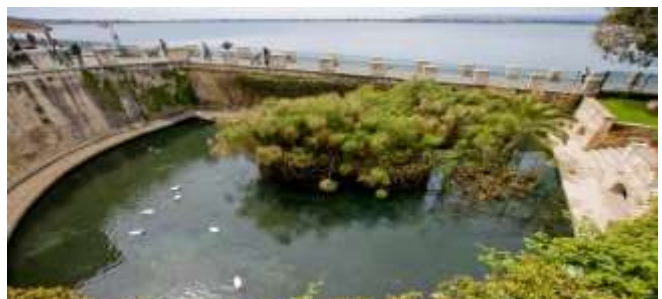
Το σιντριβάνι Αρετούσα όπου φυτρώνει και αναπτύσσεται το φυτό πάπυρος