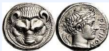
Τετράδραχμο του Ρήγιου, 415-387 π.Χ.

Το Ρήγιο ήταν μία από τις αρχαιότερες ελληνικές αποικία της Μεγάλης Ελλάδας. Ιδρύθηκε το 720 π.Χ. από Ευβοείς και αρχικά ονομαζόταν Ερυθρά. Η πόλη βρισκόταν σε ιδιαίτερα προνομιακή θέση, καθώς ήταν χτισμένη σχεδόν στο νοτιότερο σημείο της Ιταλικής χερσονήσου, στον πορθμό της Μεσσήνης.