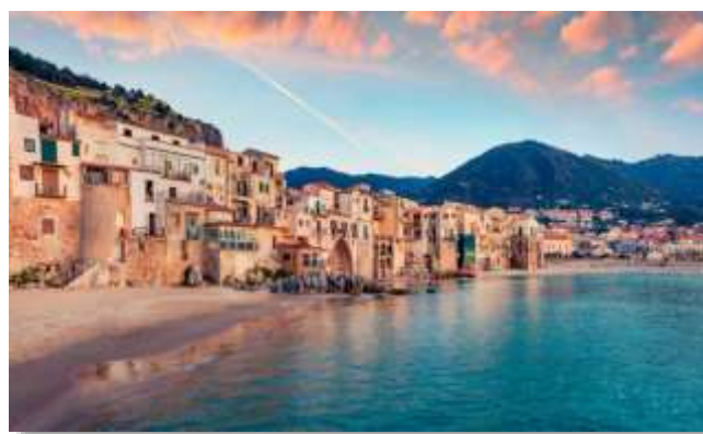
Το γραφικό λιμανάκι της Κεφαλούς στη βόρεια Σικελία. Στην πόλη υπάρχει έντονο το ελληνικό και βυζαντινό στοιχείο.