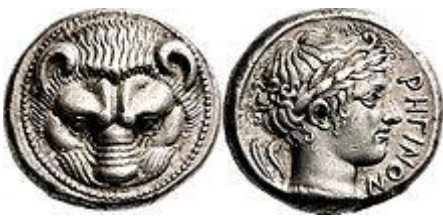
Τετράδραχμο του Ρήγιου, 415-387 π.Χ.

Το Ρήγιο ήταν μία από τις αρχαιότερες ελληνικές αποικία της Μεγάλης Ελλάδας. Ιδρύθηκε το 720 π.Χ. από Ευβοείς και αρχικά ονομαζόταν Ερυθρά. Η πόλη βρισκόταν σε ιδιαίτερα προνομιακή θέση, καθώς ήταν χτισμένη σχεδόν στο νοτιότερο σημείο της Ιταλικής χερσονήσου, στον πορθμό της Μεσσήνης.