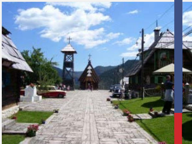
Το ξύλινο χωριό του Κουστουρίτσα

Το παραπάνω πρόγραμμα είναι ενδεικτικό. Το τελικό ενημερωτικό αποστέλλεται περίπου 3-5 ημέρες πριν από την εκάστοτε αναχώρηση.