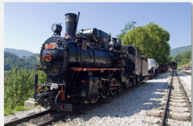
Το τρένο Σάργκαν 8