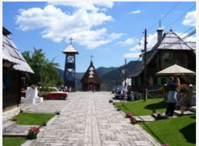
Το ξύλινο χωριό του Κουστουρίτσα