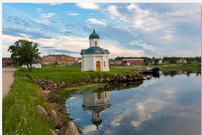
Στα Νησιά Σολοβέτσκι