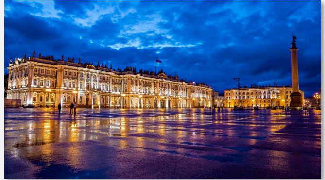
Ερμιτάζ, Αγία Πετρούπολη

Το παραπάνω πρόγραμμα είναι ενδεικτικό. Το τελικό ενημερωτικό αποστέλλεται περίπου 3-5 ημέρες πριν από την εκάστοτε αναχώρηση.