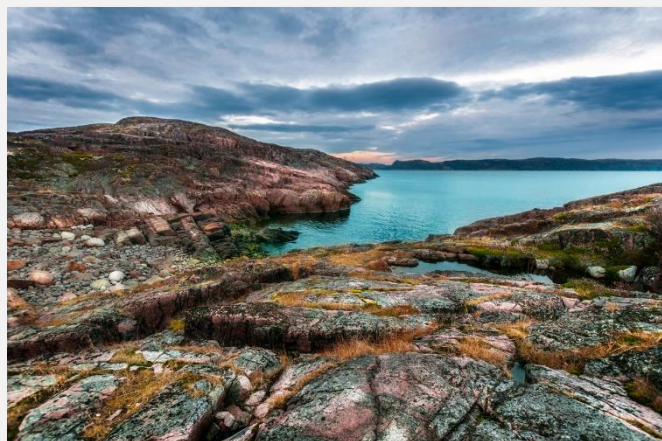
Στη Θάλασσα του Μπάρεντς

Κατά τη διάρκεια της σημερινής μας ξεναγησης θα δούμε, μεταξύ άλλων, την εκπληκτική Εκκλησία της Αναστάσεως, που μοιάζει βγαλμένη από ρωσικό παραμύθι, τον Μπρούτζινο Καβαλάρη, που απεικονίζει τον ιδρυτή της πόλης Μεγάλο Πέτρο, τη Λεωφόρο Nevsky Prospekt, το Champs Elysees της Αγίας Πετρούπολης, στην οποία βρίσκονται παλάτια, εκκλησίες, πάρκα και θέατρα σε μια ευθεία 4 χλμ., τον Καθεδρικό Ναό Καζάν, το άγαλμα του τσάρου Νικόλαου Α' και το Δημαρχείο. Στη συνέχεια θα αναχωρήσουμε για μια εκδρομή στην πόλη