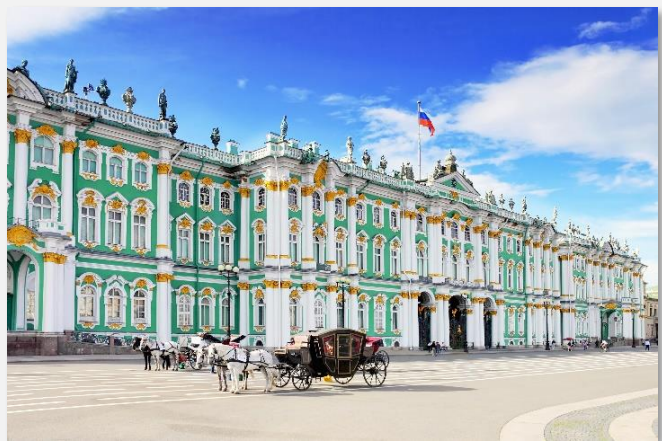
Θερινά ανάκτορα, Αγία Πετρούπολη