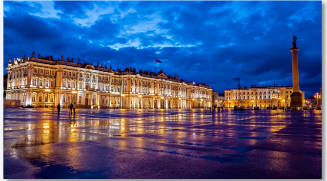
Ερμιτάζ, Αγία Πετρούπολη

Το παραπάνω πρόγραμμα είναι ενδεικτικό. Το τελικό ενημερωτικό αποστέλλεται περίπου 3-5 ημέρες πριν από την εκάστοτε αναχώρηση.