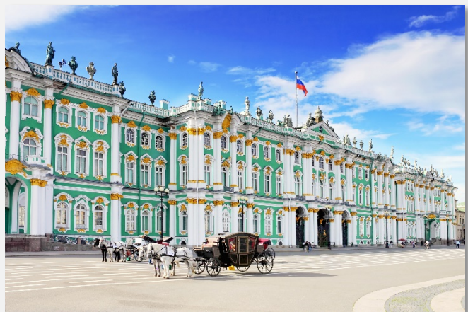
Θερινά ανάκτορα, Αγία Πετρούπολη