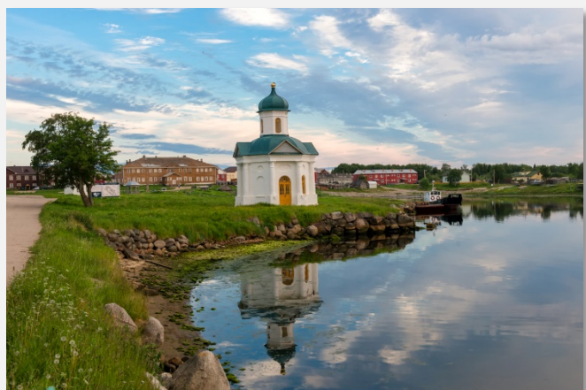
Στα Νησιά Σολοβέτσκι