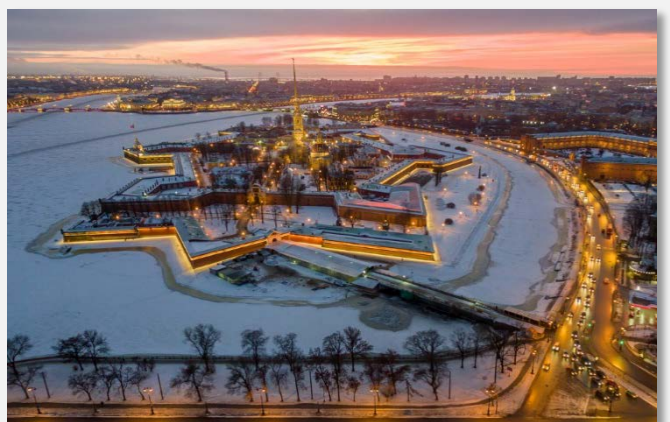
Κάστρο Πέτρου και Παύλου