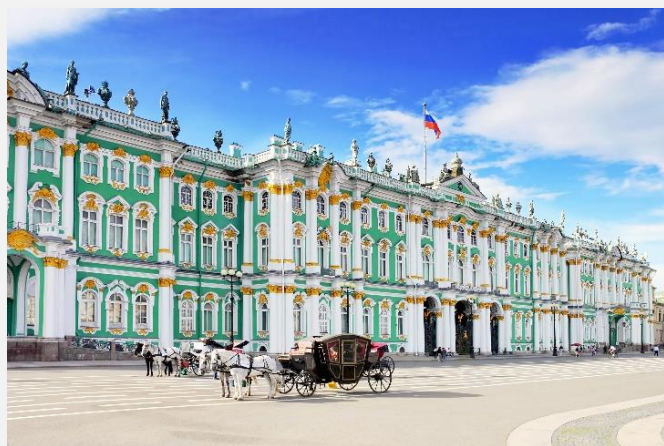
Θερινά ανάκτορα, Αγία Πετρούπολη