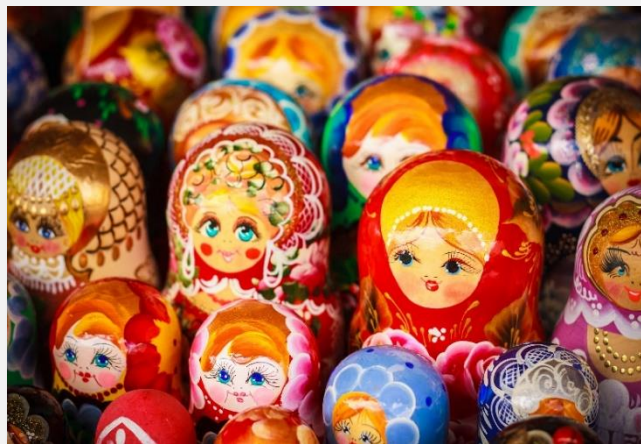
Ματριόσκες, παραδοσιακές ρωσικές κούκλες

Κατά τη διάρκεια της σημερινής μας ξενάγησης θα δούμε μεταξύ άλλων την εκπληκτική Εκκλησία της Αναστάσεως, που μοιάζει σαν βγαλμένη από ρωσικό παραμύθι, το Ινστιτούτο Σμόλνυ, απ' όπου ο Λένιν διηύθυνε τις επιχειρήσεις της λαϊκής εξέγερσης, τον Μπρουτζίνο Καβαλάρη που απεικονίζει τον ιδρυτή της πόλης Μεγάλο Πέτρο, τη Λεωφόρο Nevsky Prospekt, το Champs Elysees της Αγίας Πετρούπολης, στην οποία βρίσκονται παλάτια, εκκλησίες, πάρκα, θέατρα σε μια ευθεία 4 χιλιομέτρων, τον Καθεδρικό Ναό Καζάν , το άγαλμα του τσάρου Νικόλαου Α' και το Δημαρχείο. Στη συνέχεια θα επισκεφθούμε τον μεγαλοπρεπή Καθεδρικό Ναό του Αγίου Ισαακίου (1818-1848), ένα