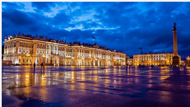
Ερμιτάζ, Αγία Πετρούπολη