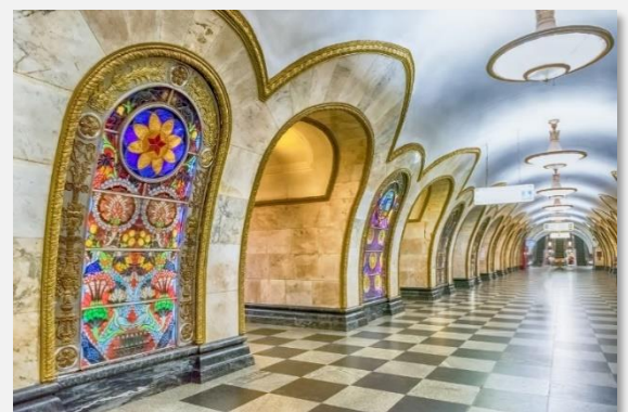
Στο Μετρό της Μόσχας