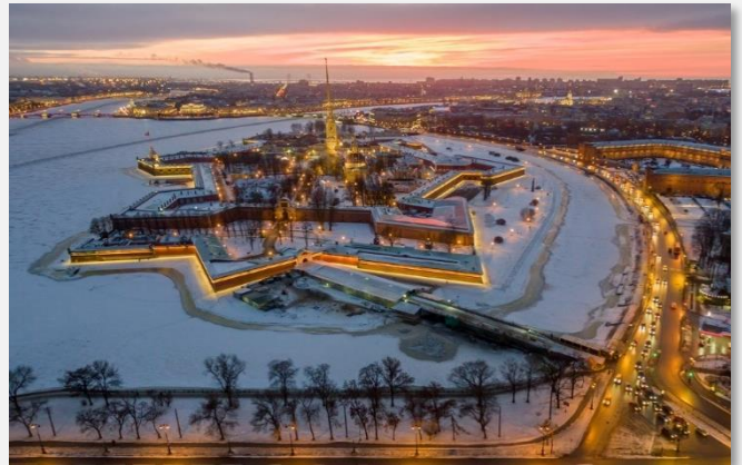
Κάστρο Πέτρου και Παύλου

Το πρωί θα επισκεφθούμε το ανάκτορο Παβλόφσκ , στις παρυφές της Αγίας Πετρούπολης, το παλάτι που έχτισε η Μεγάλη Αικατερίνη στα τέλη του 18ου αιώνα για τον γιο της, τότε Μεγάλο Δούκα Παύλο. Αρχιτέκτονας ήταν ένας Σκωτσέζος, ο Τσαρλς Κάμερον, που εμπνεύστηκε από το ύφος του Παλλάντιο για να δημιουργήσει ένα εκπληκτικό ανάκτορο που συμπληρώνεται αρμονικά από