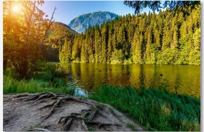
Ερυθρά Λίμνη (Λάκουλ Ρόσου)

Το παραπάνω πρόγραμμα είναι ενδεικτικό. Το τελικό ενημερωτικό αποστέλλεται περίπου 3-5 ημέρες πριν από την εκάστοτε αναχώρηση.