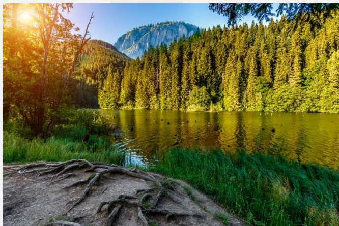
Ερυθρά Λίμνη (Λάκουλ Ρόσου)

Αναχώρηση από την Πιάτρα Νεάμτ, με προορισμό μας την πανέμορφη Σιγκισοάρα , μια όαση αρχιτεκτονικής και ιστορίας, γενέτειρα του Βλατ Τέπες, του περίφημου Δράκουλα των Καρπαθίων. Το κέντρο της πόλης περιλαμβάνεται στον Κατάλογο Παγκόσμιας Πολιτιστικής Κληρονομιάς της UNESCO. Η ακρόπολη της παραμένει επιβλητική και άθικτη από το 12ο αι. έως και σήμερα. Χτισμένη από Σάξονες εμπόρους, αποτελεί εξαιρετο παράδειγμα οχυρωμένης μεσαιωνικής πόλης που διαδραμάτισε σημαντικό στρατηγικό και εμπορικό ρόλο για αρκετούς αιώνες. Άφιξη και βόλτα στην παλιά πόλη, κατά τη διάρκεια της οποίας θα δούμε τον Πύργο του Ρολογιού, την Εκκλησία του Λόφου, το σπίτι όπου γεννήθηκε ο Δράκουλας κ.ά. Μετά τη βόλτα μας θα συνεχίσουμε για το Τάργκου Μούρες. Άφιξη, μεταφορά και τακτοποίηση στο ξενοδοχείο μας. Δείπνο και διανυκτέρευση.