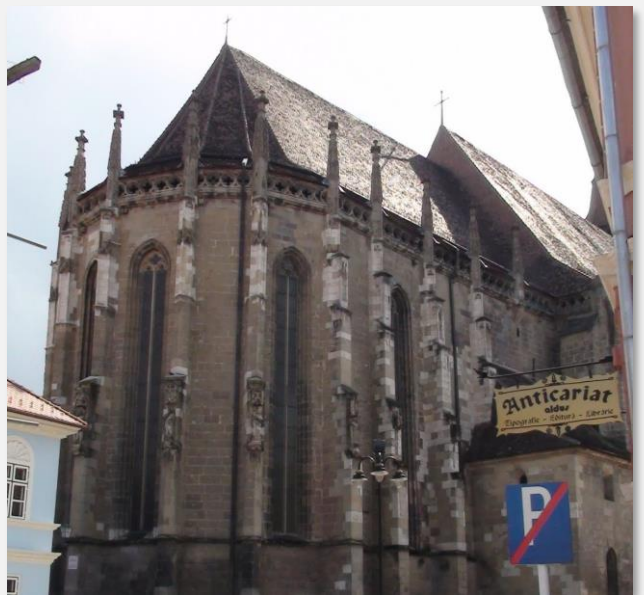
Μαύρη Εκκλησία - Μπρασόβ