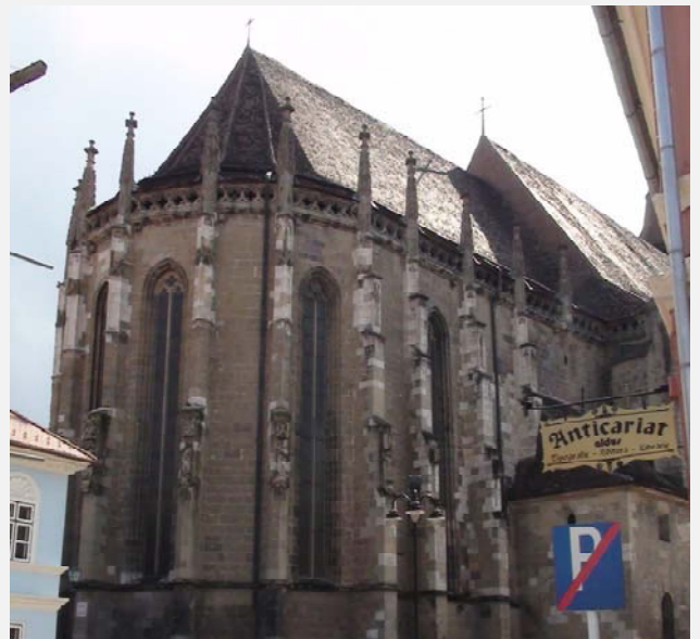
Μαύρη Εκκλησία - Μπρασόβ