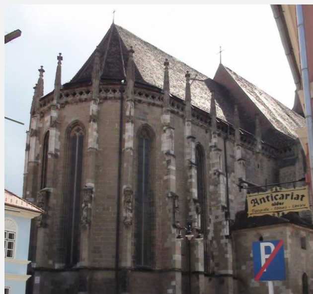
Μαύρη Εκκλησία - Μπρασόβ