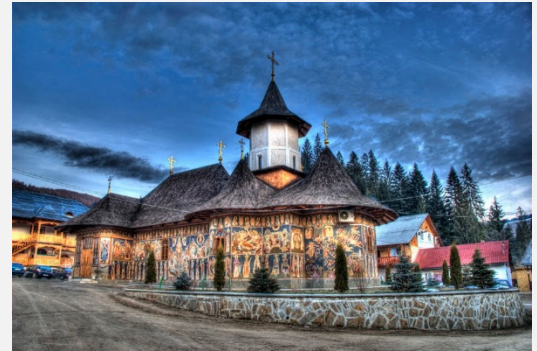
Ζωγραφισμένα Μοναστήρια της Μπουκοβίνα