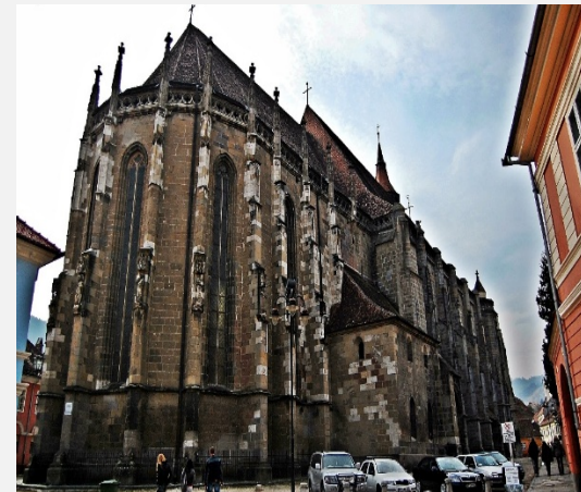
Μαύρη Εκκλησία - Μπρασόβ