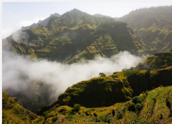
Ορεινό πράσινο τοπίο στο Σάντο