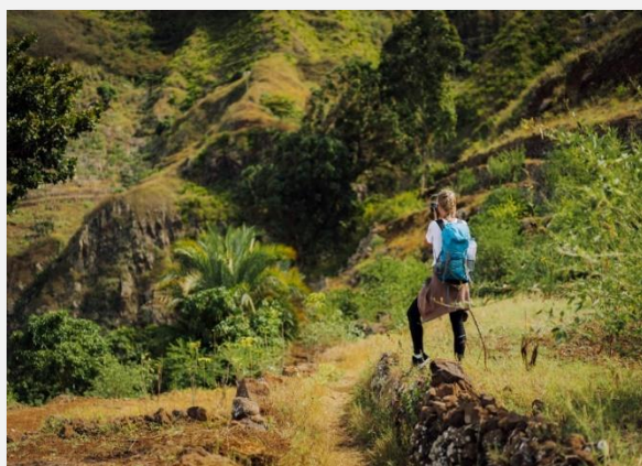
Οι φίλοι της φωτογραφίας θα λατρέψουν το Σάντο Αντάο