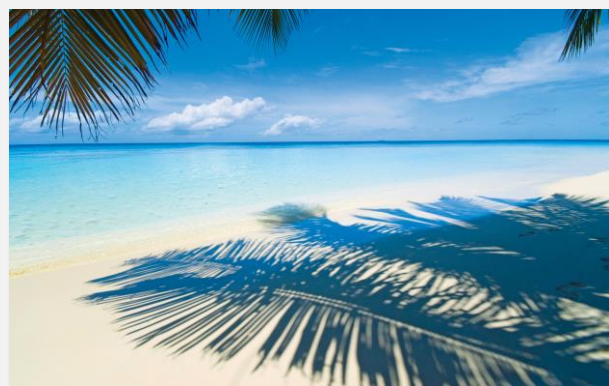
Χαρακτηριστική λευκή παραλία στο Πράσινο Ακρωτήριο