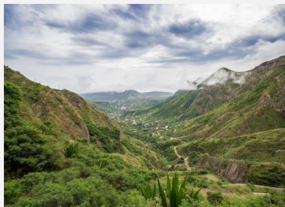
Καταπράσινο τοπίο στο Σάντο Αντάο