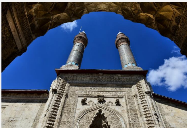
Τζοκ Μεντρεσές, Σιβάς