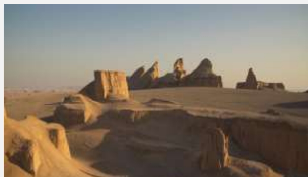
Έρημος Καλούτ Σαχτάντ

Στη συνέχεια αφήνουμε πίσω μας το υπέροχο Κερμάν και αναχωρούμε με τελικό μας προορισμό τη Γιαζντ. Καθ'