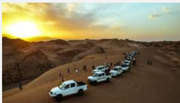
Off road εμπειρία στην έρημο