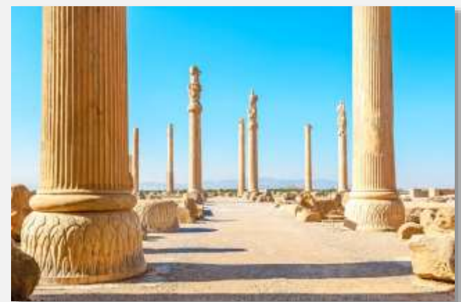
Το παλάτι του Δαρείου, στην Περσέπολη