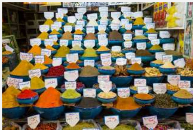
Παζάρι στη Σιράζ