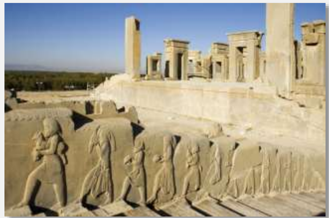
Ανάμεσα στα ανάκτορα του Δαρείου και του Ξέρξη

Το παραπάνω πρόγραμμα είναι ενδεικτικό. Ανάλογα με τις συνθήκες, η σειρά των ξεναγήσεων μπορεί να αλλάξει για την καλύτερη διεξαγωγή του προγράμματος χωρίς να παραληφθεί κάτι από τα παραπάνω γραφόμενα.