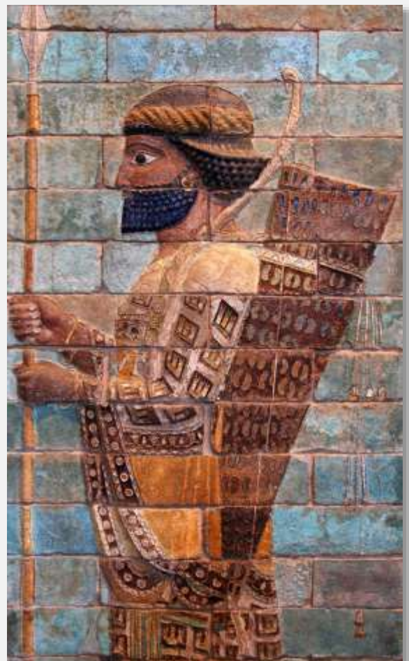
Αρχαίος Πέρσης στρατιώτης