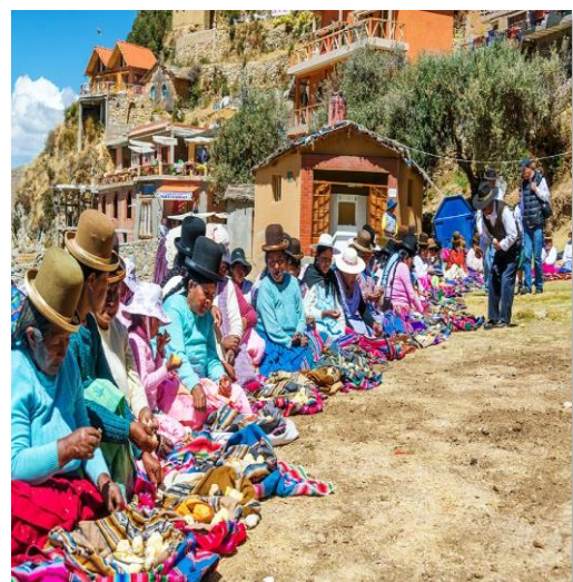
Τοπική λαϊκή αγορά στο Περού