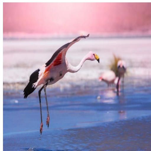
Θαλασσοπούλια στο Μπαγιέστας