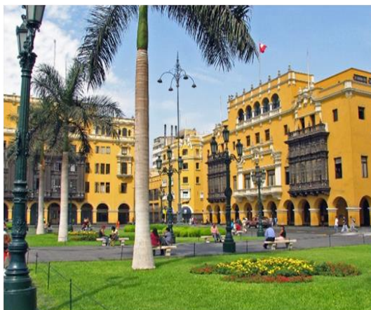
Λίμα, η πρωτεύουσα του Περού

Για δύο ημέρες θα αφήσουμε πίσω μας τον πολιτισμό, θα ξεχάσουμε τα κινητά μας τηλέφωνα, τις τηλεοράσεις και τις ειδήσεις και θα αναπνεύσουμε κάτι από τη ζούγκλα του Αμαζονίου, τον μεγαλύτερο πνεύμονα του πλανήτη μας, που δυστυχώς χάνεται προς «όφελος» του πολιτισμού μας. Το αεροπλάνο θα μας μεταφέρει στο Πουέρτο Μαλδονάδο, μια πόλη 90.000 κατοίκων, πρωτεύουσα της περιοχής, χτισμένη πάνω στη συμβολή δύο παραποτάμων του Αμαζονίου, του Μάντρε ντε Ντίος και του Ταμποπάτα. Αφού επισκεφθούμε την πολύχρωμη και πολύβουη λαϊκή αγορά της πόλης (αν ο χρόνος το επιτρέπει), θα μεταφερθούμε στο λιμάνι, απ' όπου με μηχανοκίνητη πιρόγα θα αναχωρήσουμε για τον καταυλισμό που θα μας φιλοξενήσει. Χτισμένος στην όχθη του Μάδρε ντε Ντίος πάνω σε ξύλινους πασσάλους, θα μας γνωρίσει τη φύση και τη ζωή στη ζούγκλα. Μετά το γεύμα θα πραγματοποιήσουμε την πρώτη μας εξόρμηση στο κοντινό νησί των μαϊμούδων.