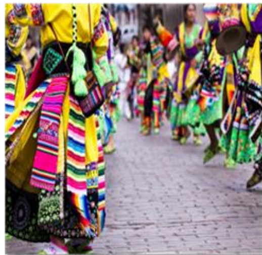
Χορευτές σε γιορτή στο Κούσκο