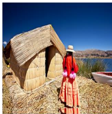
Νησιά Ούρος, λίμνη Τιπικάκα