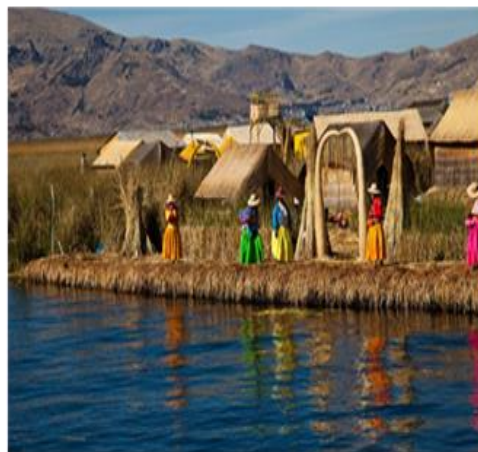
Στη λίμνη Τιπικάκα