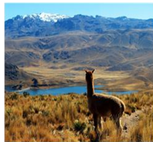
Αλπάκα ατενίζει λίμνη στο βόρειο Περού