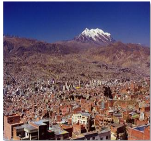
Λα Παζ, η πρωτεύουσα της Βολιβίας