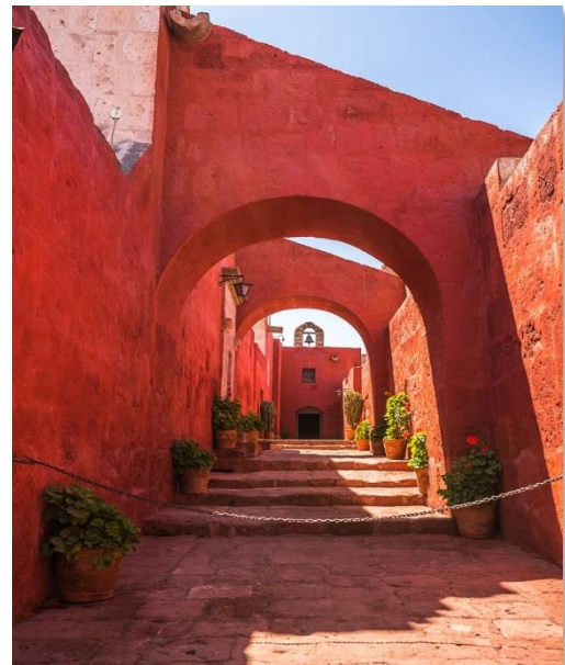
Στο μοναστήρι της Santa Catalina, στην Αρεκίπα