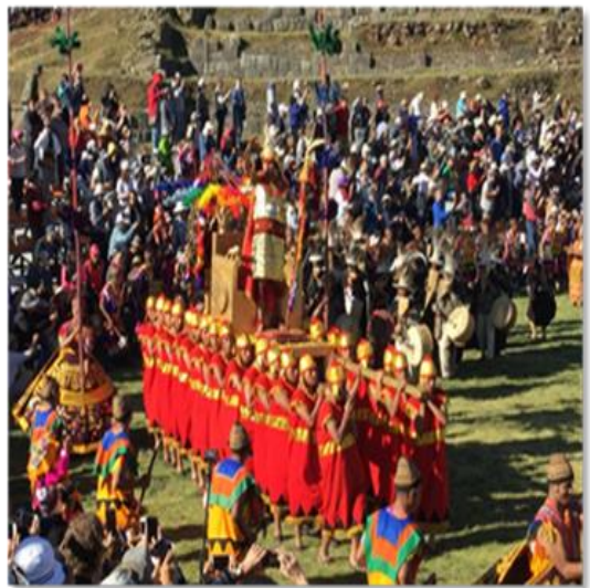
Στη Γιορτή του Ήλιου