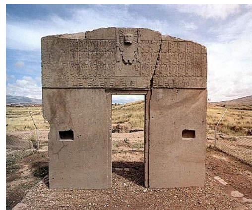
Η Πύλη του Ήλιου