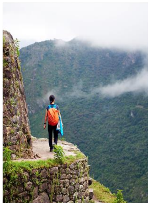
Περπατώντας πάνω απ' τα σύννεφα, στο Μάτσου Πίτσου