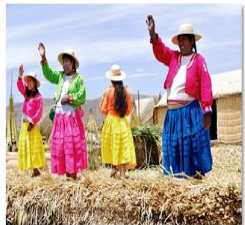
Στη λίμνη Τιτικάκα