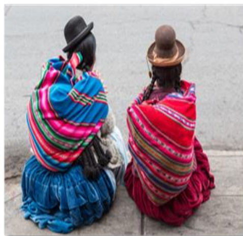
Γυναίκες με παραδοσιακές ενδυμασίες στο Πούνο

Πρωινό και αναχωρούμε για τα σύνορα. Αφού περάσουμε τις συνοριακές και τελωνιακές διατυπώσεις, μπαίνουμε στο έδαφος της Βολιβίας και οδεύουμε προς τον