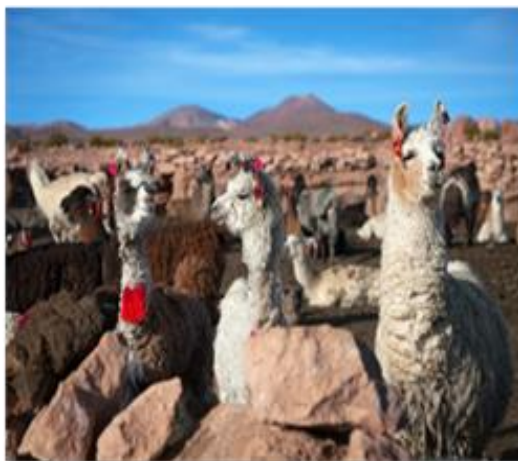
Λάμα, σήμα-κατατεθέν του Περού

Αποχαιρετάμε σήμερα τη ζώνη της Αμαζονίας και πετάμε για το Κούσκο. Φθάνουμε στο Κούσκο, που το όνομά του σημαίνει «Ομφαλός της Γης». Για τον ιστορικό, τον αρχαιολόγο, τον κοινωνιολόγο, τον εθνολόγο, τον καλλιτέχνη, το φωτογράφο και τον κάθε τουρίστα, το Κούσκο προσφέρει ανεξάντλητο υλικό. Ο τόπος όπου άκμασε και καταλύθηκε ο πολιτισμός των Ίνκας διατηρεί μέσα στα πέτρινα τείχη και τις οχυρώσεις του ιστορικά μνημεία, ερείπια, μύθους και παραδόσεις. Είναι μια τυπική Ισπανική πόλη κτισμένη στα τείχη και τα θεμέλια των Ίνκας. Από το 1983 έχει συμπεριληφθεί στον κατάλογο των μνημείων παγκόσμιας κληρονομιάς της UNESCO. Άφιξη και τακτοποίηση στο ξενοδοχείο μας. Διανυκτέρευση.