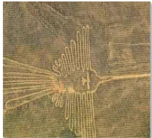
Στο οροπέδιο της Νάσκα