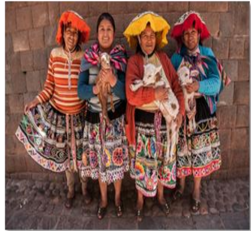
Γυναίκες με παραδοσιακές φορεσιές

Διαδρομή πολυποικίλη η σημερινή, με τοπία άγριας ομορφιάς συνεχώς εναλλασσόμενα και με το εντυπωσιακό υψόμετρο των 4.335 m στη Λα Ράγια, στα σύνορα ακριβώς των δυο νομών. Στη διαδρομή μας θα επισκεφθούμε το Σιγιουστάνι, τη νεκρόπολη των Κόγιας και των Ίνκας, οι οποίοι επέλεξαν τον χώρο αυτό για να θάβουν τους υψηλούς νεκρούς τους. Θα ξεναγηθούμε στη νεκρόπολη, θα δούμε τον τρόπο ταφής των νεκρών, αλλά και τον τρόπο χτισίματος των ταφικών μνημείων. Επίσης,