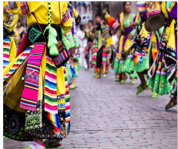
Χορευτές σε γιορτή στο Κούσκο