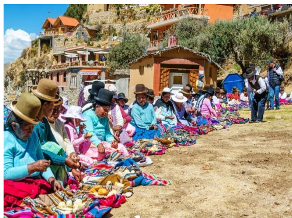
Τοπική λαϊκή αγορά στο Περού