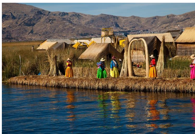
Στη λίμνη Τιτικάκα