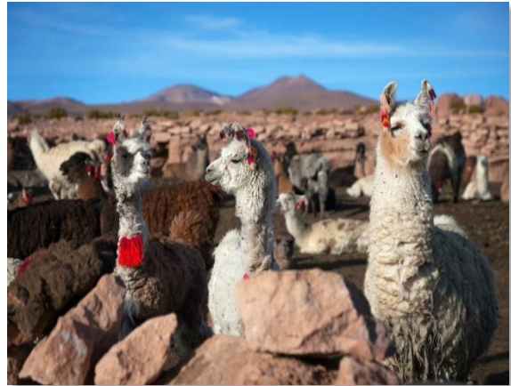
Λάμα, σήμα-κατατεθέν του Περού

Βιλκανότα ή Ιερή κοιλάδα, κατά μήκος της οποίας οι Ίνκας έχτισαν τις σημαντικότερες πόλεις τους. Μία από αυτές είναι το Πίσαςκ, εμπορικό κέντρο της περιοχής τότε και τώρα. Πολύχρωμη πολύβουη, πολυπληθής πολυ...πάζαρη, η αγορά του Πίσαςκ προσφέρεται για είδη λαϊκής περουβιανής τέχνης. Μάλλινα, ριχτάρια, καλύμματα, πήλινα, αντικες, ξύλινα, δερμάτινα και βέβαια κόκα, είναι τα αγαθά που μπορείτε να διαλέξετε από αυτήν την αγορά. Μην παραλείψετε να γευθείτε μια εμπανάδα και τσίτσαμοράδα. Τι είναι αυτά; Θα σας εξηγήσει ο ξεναγός σας. Μία από τις