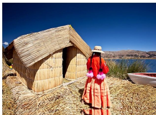
Νησιά Ούρος, λίμνη Τιτικάκα