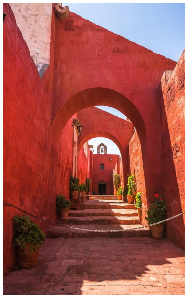
Στο μοναστήρι της Santa Catalina, στην Αρεκίπα