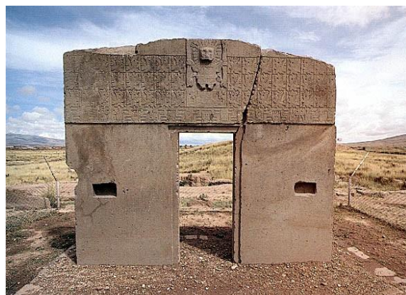
Η Πύλη του Ήλιου