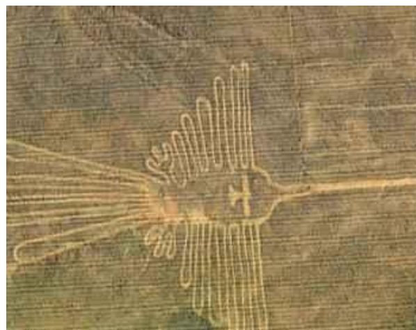
Στο οροπέδιο της Νάσκα