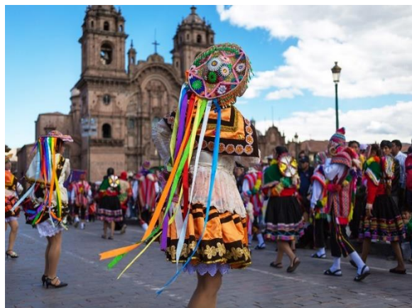
Παραδοσιακοί χοροί στο Κούσκο

Η σημαντικότερη ανάμνηση του ταξιδιού μας θα είναι σε λίγες ώρες πραγματικότητα. Αφού πραγματοποιήσουμε μία διαδρομή με πούλμαν, επιβιβαστούμε στο τραίνο που τρέχει παράλληλα με τον ιερό ποταμό κατά μήκος της Ιερής Κοιλάδας, μέχρι την περιοχή ΆγουαςΚαλιέντες (Aguas Calientes – Θερμά Νερά). Από εδώ επιβιβαστούμε σε άλλο πούλμαν, που θα μας φέρει στην είσοδο του αρχαιολογικού χώρου του Μάτσου Πίτσου. Οι λέξεις είναι φτωχές να πουν και οι φωτογραφικές μηχανές να αποτυπώσουν τη μαγεία που μόνο η ψυχή μπορεί να δει. Φωτισμένα μυαλά επέλεξαν τον χώρο στην άκρη της ιερής κοιλάδας για να χτίσουν την ιερή πόλη των Ίνκας, που εγκαταλείφθηκε λίγο πριν μπουν οι Ισπανοί στην αυτοκρατορία, διατηρώντας έτσι την απόλυτη μυστικότητά της μέχρι το 1911, όταν την ανακάλυψε ο Χάιραμ Μπίνγκαμ. Ένα