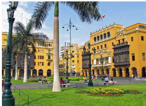
Λίμα, η πρωτεύουσα του Περού

Η πιο συγκλονιστική «μελλοντική ανάμνηση» μας περιμένει σήμερα το πρωί. Μεταφερόμαστε στο αεροδρόμιο απ' όπου πετώντας με μονοκινητήριο έχουμε την μοναδική ευκαιρία να θαυμάσουμε από ψηλά το οροπέδιο της Νάσκα, την Πάμππα, όπου πριν από 2.000 χρόνια δημιουργήθηκαν οι μοναδικοί αυτοί γεωγλυφικοί σχηματισμοί πάνω στο ξηρό και άγονο έδαφος της, σε μια περιοχή που καταλαμβάνει έκταση 525 km 2 . Πέπλο μυστηρίου καλύπτει τη δημιουργία των σχηματισμών αυτών. Ο Έριχ φον Ντάνικεν υποστηρίζει πως είναι έργα εξωγήινων πολιτισμών, ενώ διαπρεπείς επιστήμονες, όπως η Μαρία Ράιχε και ο