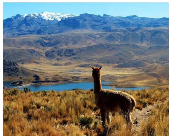
Αλπάκα στενίζει λίμνη στο βόρειο Περού