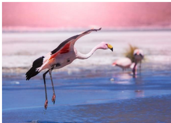
Θαλασσοπούλια στο Μπαγιέ-

Η ονομασία «Αρεκίπα» είναι αβέβαιης ετοιμολογίας, αλλά πιθανότατα στη γλώσσα των Αϊμάρα (Aymara) σημαίνει «πέρα από την κορυφή», εννοώντας την κορυφή του ηφαιστείου Ελ Μίστι (El Misti, υψόμετρο 5.822 m), ενός εκ των τριών που είναι ορατά από την πόλη. Τα άλλα δύο είναι το Τσατσάνι (Chachani, υψόμετρο 6.075 m) και το Πίτσου Πίτσου (Pichu Pichu, υψόμετρο 5.669 m). Η αποικιακή αυτή πόλη, που ιδρύθηκε το 1540 από τον Γκάρσι Μανουέλ ντε Καρμπαχάλ (Garcí Manuel de Carbajal), είναι γραφικότητα, με τους κώνους των τριών ηφαιστειών να υψώνονται γύρω της, αλλά και ηφαιστειογενής, δεδομένου ότι σε κοντινή απόσταση υπάρχουν περισσότερα από 80 ηφαιστεια. Άλλωστε, οι εναποθέσεις ηφαιστειακής λάβας από τα γύρω ηφαιστεια έχουν καταστήσει το έδαφος γονιμότατο και ο πλούτος της πόλης βασιζόταν ανέκαθεν στη γεωργία. Η Αρεκίπα λέγεται η «Λευκή Πόλη», καθότι κατά την οικοδόμησή της χρησιμοποιήθηκε ευρύτατα το «σιγιάρ» (sillar), ένα λευκό, ελαφρύ και αδιάβροχο ηφαιστιογενές πέτρωμα. Κατά τη διάρκεια της σημερινής ξενάγησής μας θα επισκεφθούμε το γυναικείο μοναστήρι της Santa Catalina, ένα μεγάλο συγκρότημα που εγκαινιάστηκε το 1580 και είναι κτισμένο σε στυλ μουδέχαρ (mudejar: μίξη ευρωπαϊκών και αραβικών στοιχείων που έφεραν οι Ισπανοί). Θα επισκεφθούμε επίσης το «Μουσείο των Ιερών των Άνδεων» (Museum Santuario Andinos), όπου εκτίθενται μούμιες που βρέθηκαν στις Άνδεις - από το Περού, τη Χιλή και την Αργεντινή. Το πιο γνωστό έκθεμα είναι η μούμια της «Χουανίτα»