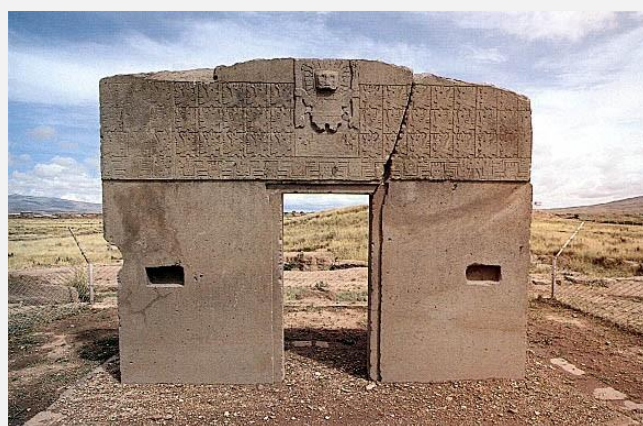
Η Πύλη του Ήλιου