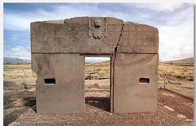
Η Πύλη του Ήλιου