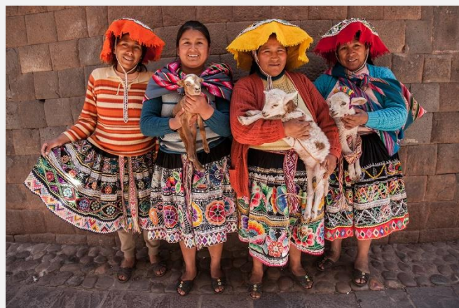
Γυναίκες με παραδοσιακές φορεσιές

Αναχώρηση για τη Βιλκανότα ή Ιερή κοιλιάδα, κατά μήκος της οποίας οι Ίνκας έχτισαν τις σημαντικότερες πόλεις τους. Μία από αυτές είναι το Πίσακ, εμπορικό κέντρο της περιοχής τότε και τώρα. Πολύχρωμη πολύβουη, πολυπληθής πολυ... πάζαρη, η αγορά του Πίσακ προσφέρεται για είδη λαϊκής περουμενικής τέχνης. Μάλλινα, ριχτάρια, καλύμματα, πήλινα, αντικείμενα, ξύλινα, δερμάτινα και βέβαιο κόκα, είναι τα αγαθά που μπορείτε να διαλέξετε από αυτήν την αγορά. Μην παραλείψετε να γευθείτε μια εμπανάδα και τσίτσα μοράδα. Τι είναι αυτά; Θα σας