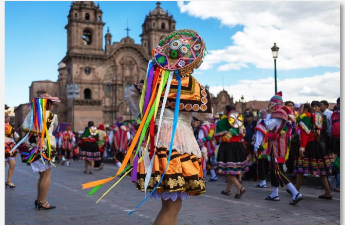
Παραδοσιακοί χοροί στο Κούσκο

Πρωινή ξενάγηση της πόλης. Πρώτη μας επίσκεψη η Κορικάντσα, ο σημαντικότερος Ναός των Ίνκας στο Κούσκο, τόπος λατρείας του Ήλιου και των Ουράνιων σωμάτων, με θαυμαστή αρχιτεκτονική. Οι Δομινικανοί μοναχοί έχτισαν εδώ τον Ναό και το Μοναστήρι του Σάντο Ντομίνγκο. Στη συνέχεια θα επισκεφθούμε την ομορφότερη πλατεία του Περού,