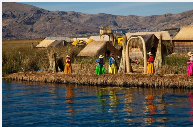
Στη λίμνη Τιτικάκα