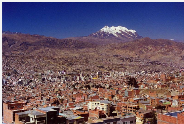
Λα Παζ, η πρωτεύουσα της Βολιβίας