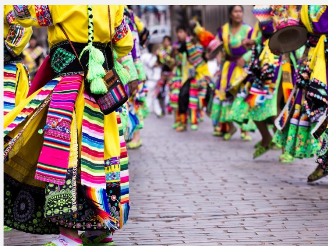
Χορευτές σε γιορτή στο Κούσκο