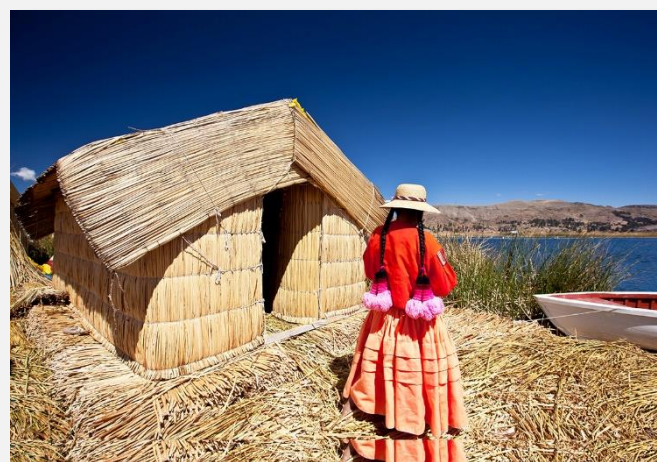
Νησιά Ούρος, λίμνη Τιτικάκα