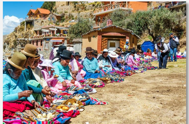
Τοπική λαϊκή αγορά στο Περού