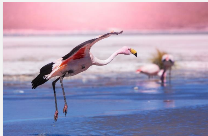
Θαλασσοπούλια στο Μπαγιέστας

Πτήση για την Αρεκίπα, τη δεύτερη σε μέγεθος πόλη του Περού, πρωτεύουσα της ομώνυμης επαρχίας, που είναι κτισμένη σε υψόμετρο 2.360 μέτρων. Άφιξη και τακτοποίηση στο ξενοδοχείο μας. Η ονομασία «Αρεκίπα» είναι αβέβαιης ετοιμολογίας, αλλά πιθανότατα στη γλώσσα των Αϊμάρα (Aymara) σημαίνει «πέρα από την κορυφή», εννοώντας την κορυφή του ηφαιστείου Ελ Μίστι (El Misti, υψόμετρο 5.822 m), ενός εκ των τριών που είναι ορατά από την πόλη. Τα άλλα δύο είναι το Τσατσάνι (Chachani, υψόμετρο 6.075 m) και το Πίτσου Πίτσου (Pichu Pichu, υψόμετρο 5.669 m). Η αποικιακή αυτή πόλη, που ιδρύθηκε το 1540 από τον Γκάρσι Μανουέλ ντε Καρμπαχάλ (Garcí Manuel de Carbajal), είναι γραφικότερη, με τους κώνους των τριών ηφαιστειών να υψώνονται γύρω της, αλλά και ηφαιστειογενής, δεδομένου ότι σε κοντινή απόσταση υπάρχουν περισσότερα από 80 ηφαιστεια.