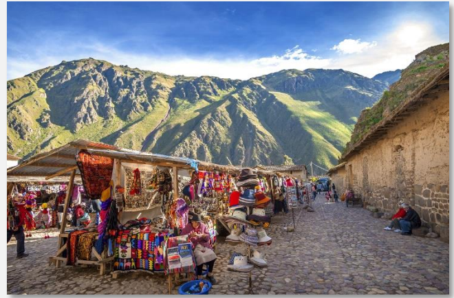
Στην αγορά του Πισακ

Το παραπάνω πρόγραμμα είναι ενδεικτικό. Το τελικό ενημερωτικό αποστέλλεται περίπου 3-5 ημέρες πριν από την εκάστοτε αναχώρηση.