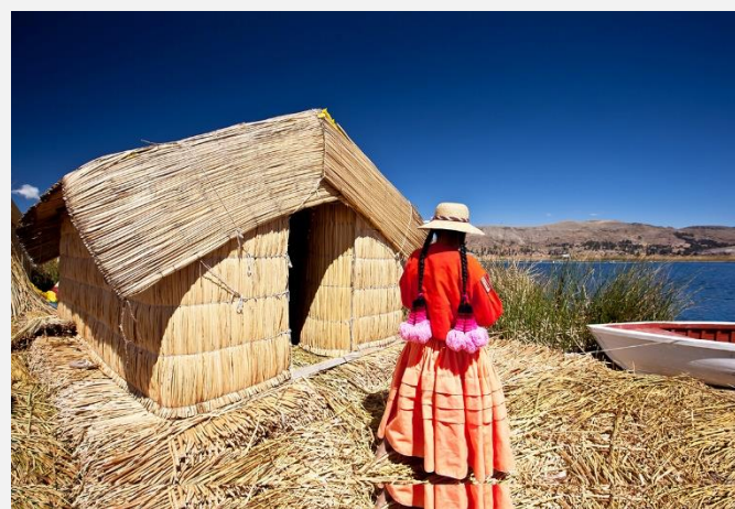
Νησιά Ούρος, λίμνη Τιτικάκα