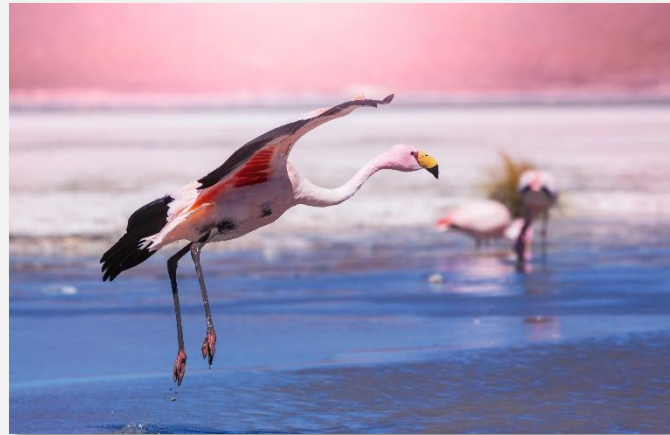
Θαλασσοπούλια στο Μπαγιέστας