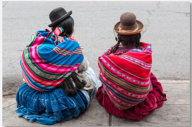
Γυναίκες με παραδοσιακές ενδυμασίες στο Πούνο