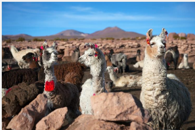
Λάμα, σήμα-κατατεθέν του Περού

Διαδρομή πολυποίκιλη η σημερινή, με τοπία άγριας ομορφιάς συνεχώς εναλλασσόμενα και με το εντυπωσιακό υψόμετρο των 4.335 m στη Λα Ράγια, στα σύνορα ακριβώς των δυο νομών. Στη διαδρομή μας θα επισκεφθούμε το Σιγιουστάνι, τη νεκρόπολη των Κόγιας και των Ίνκας, οι οποίοι επέλεξαν τον χώρο αυτό για να θάβουν τους υψηλούς νεκρούς τους. Θα ξεναγηθούμε στη νεκρόπολη, θα δούμε τον τρόπο ταφής των νεκρών, αλλά και