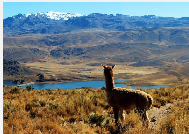
Αλπάκα ατενίζει λίμνη στο βόρειο Περού