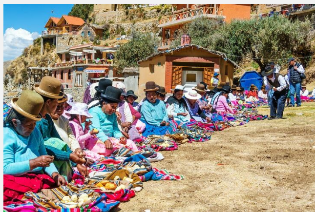
Τοπική λαϊκή αγορά στο Περού