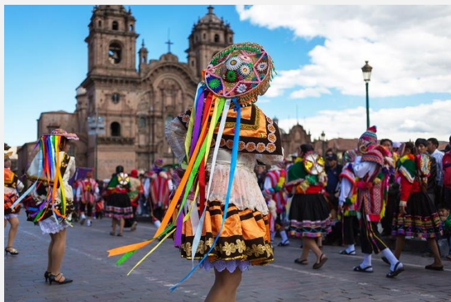
Παραδοσιακοί χοροί στο Κούσκο

Πρωινή ξενάγηση της πόλης. Πρώτη μας επίσκεψη η Κορικάντσα, ο σημαντικότερος Ναός των Ίνκας στο Κούσκο, τόπος λατρείας του Ήλιου και των Ουράνιων σωμάτων, με θαυμαστή αρχιτεκτονική. Οι Δομινικανοί μοναχοί έχτισαν εδώ τον Ναό και το Μοναστήρι του Σάντο Ντομίνγκο. Στη συνέχεια θα επισκεφθούμε την ομορφότερη πλατεία του Περού, αυτή των Όπλων, στο κέντρο της πόλης. Η μοναδική πολεοδομική ικανότητα των Ίνκας δημιούργησε μία από τις ωραιότερες πλατείες του κόσμου, σήμα κατατεθέν του Κούσκο. Εδώ βρίσκεται ο αριστουργηματικός Καθεδρικός Ναός, χτισμένος στη θέση που βρισκόταν το αυτοκρατορικό ανάκτορο των Ίνκας. Υπέροχος ναός, με μοναδικά δείγματα πρώιμης χριστιανικής αγιογραφίας της ζωγραφικής σχολής του Κούσκο. Στη συνέχεια θα κατευθυνθούμε προς τον αρχαιολογικό χώρο λίγο έξω και πάνω από το Κούσκο, αφού από τα 3.300 m που βρίσκεται η πόλη, θα φθάσουμε 3.560 m, για να επισκεφθούμε το επιβλητικό φρούριο Σαξαουαμάν, με το τριπλό κυκλώπειο τείχος, ένα μεγαλιθικό μνημείο αλησμόνητης ομορφιάς και θρησκευτικής σημασίας. Εδώ λατρευόταν ο θεός Ήλιος και ο Κεραυνός, σε τελετές που γίνονται ακόμη και σήμερα κατά τη διάρκεια του χειμερινού ηλιοστασίου. Επόμενη στάση μας είναι στο Κένκο (λαβύρινθος), ναός της Μητέρας-Γης και του Πούμα, που είναι λαξεμένος πάνω σε έναν βράχο. Περνώντας από