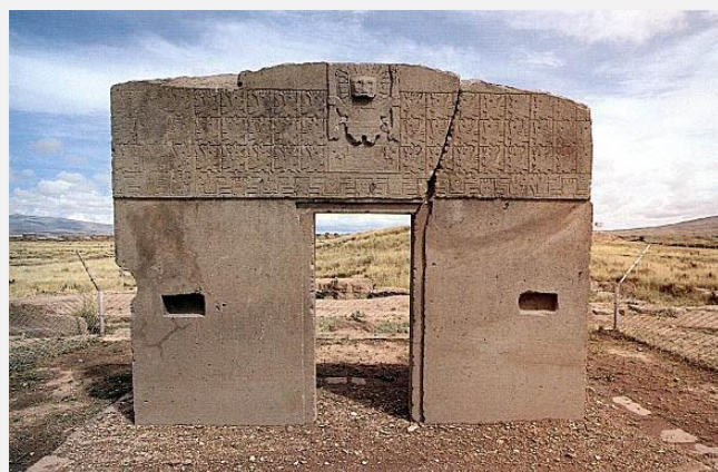
Η Πύλη του Ήλιου