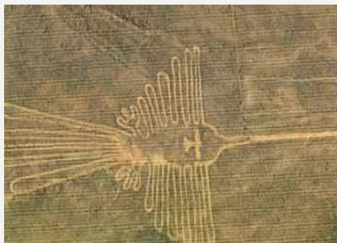
Στο οροπέδιο της Νάσκα