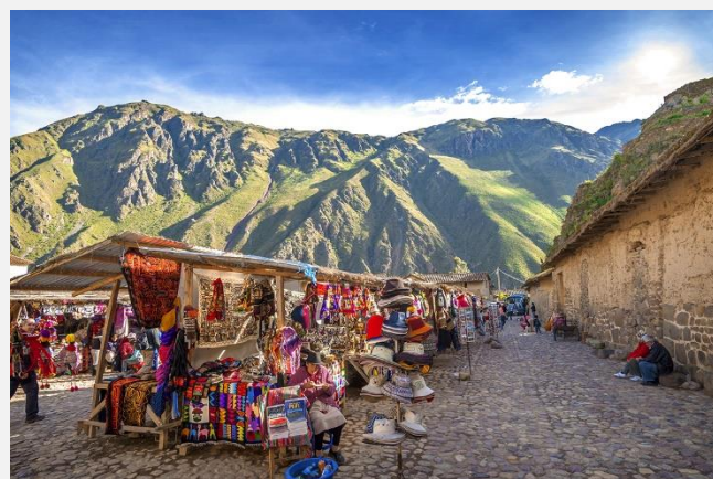
Στην αγορά του Πισακ

Το παραπάνω πρόγραμμα είναι ενδεικτικό. Το τελικό ενημερωτικό αποστέλλεται περίπου 3-5 ημέρες πριν από την εκάστοτε αναχώρηση.