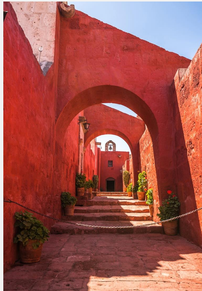
Στο μοναστήρι της Santa Catalina, στην Αρεκίπα