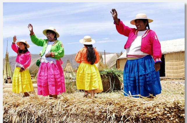
Στη λίμνη Τιπικάκα