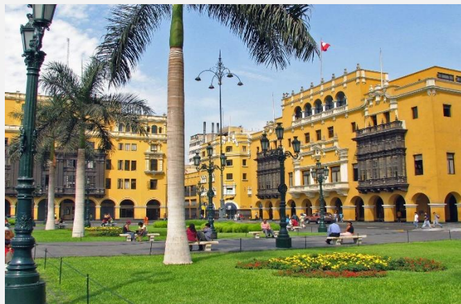
Λίμα, η πρωτεύουσα του Περού

Σήμερα θα κατευθυνθούμε στο Παράκας και από εκεί θα αναχωρήσουμε με ταχύπλοο για μια δώρη κρουαζιέρα στον υδροβιότοπο Μπαγιέσας, έναν επίγειο παράδεισο για πουλιά και θαλάσσιους λέντες. Μία σειρά από άγριες, απρόσιτες και φυσικά ακατοίκητες βραχονησίδες αποτελούν τον υδροβιότοπο αυτό, ο οποίος φιλοξενεί χιλιάδες θαλασσοπούλια, όπως γλάρους, πελεκάνους, κορμοράνους