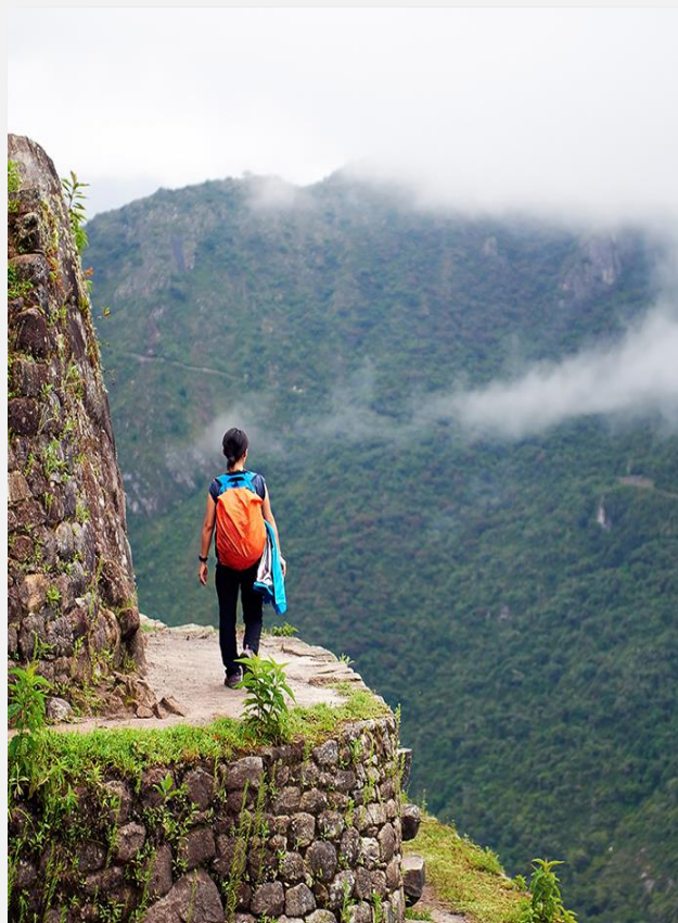
Περπατώντας πάνω απ' τα σύννεφα, στο Μάτσου Πίτσου