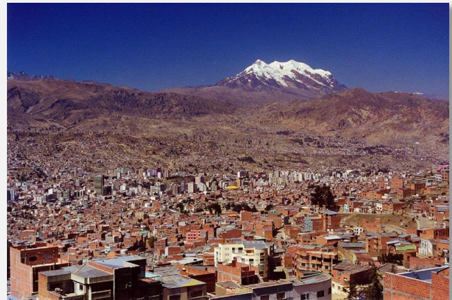
Λα Παζ, η πρωτεύουσα της Βολιβίας