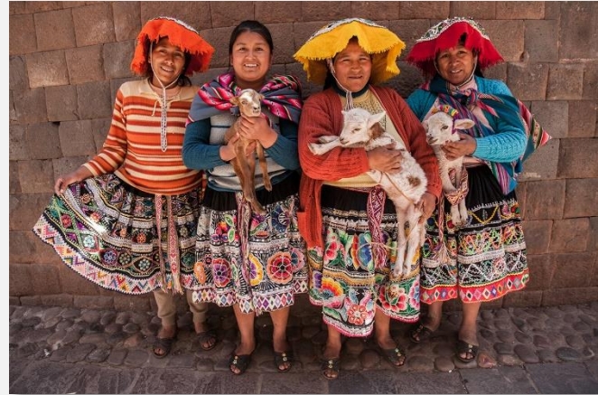
Γυναίκες με παραδοσιακές φορεσιές

Η σημαντικότερη ανάμνηση του ταξιδιού μας θα είναι σε λίγες ώρες πραγματικότητα. Αφού πραγματοποιήσουμε μία διαδρομή με πούλμαν, επιβιβαστήμαστε στο τραίνο που τρέχει παράλληλα με τον ιερό ποταμό κατά μήκος της Ιερής Κοιλιάδας, μέχρι την περιοχή Άγουας Καλιέντες (Aguas Calientes – Θερμά Νερά). Από εδώ επιβιβαστούμε σε άλλο πούλμαν, που θα μας φέρει στην