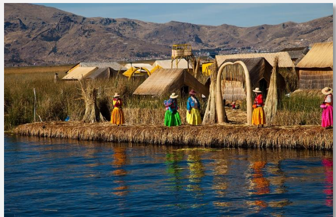
Στη λίμνη Τιτικάκα