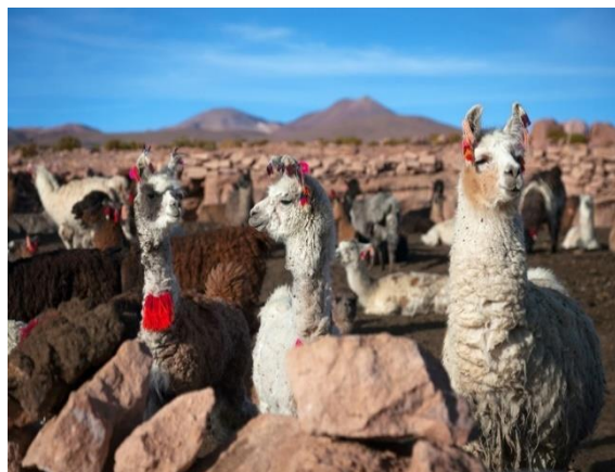
Λάμα, σήμα-κατατεθέν του Περού

Διαδρομή πολυποικιλητή η σημερινή, με τοπία άγριας ομορφιάς συνεχώς εναλλασσόμενα και με το εντυπωσιακό υψόμετρο των 4.335 m στη Λα Ράγια, στα σύνορα ακριβώς των δυο νομών. Στη διαδρομή μας θα επισκεφθούμε το Σιγουστάνι, τη νεκρόπολη των Κόγιας και των Ίνκας, οι οποίοι επέλεξαν τον χώρο αυτό για να θάβουν τους υψηλούς νεκρούς τους. Θα ξεναγηθούμε στη νεκρόπολη, θα δούμε τον τρόπο ταφής των νεκρών, αλλά και τον τρόπο χτισίματος των ταφικών μνημείων. Επίσης, θα σταματήσουμε στο σπίτι ενός ιθαγενούς της κοινότητας των Κόγιας, για να δούμε από κοντά τον παραδοσιακό τρόπο ζωής των ιθαγενών του υψιπέδου του Περού. Συνεχίζοντας φθάνουμε στο Κούσκο, που το όνομά του σημαίνει «Ομφαλός της Γης». Για τον ιστορικό, τον αρχαιολόγο, τον κοινωνιολόγο, τον εθνολόγο, τον καλλιτέχνη, το φωτογράφο και τον κάθε τουρίστα, το Κούσκο προσφέρει ανεξάντλητο υλικό. Ο τόπος όπου άκμασε και καταλύθηκε ο πολιτισμός των Ίνκας διατηρεί μέσα στα πέτρινα τείχη και τις οχυρώσεις του ιστορικά μνημεία, ερείπια, μύθους και παραδόσεις. Είναι μια τυπική Ισπανική πόλη χτισμένη στα τείχη και τα θεμέλια των Ίνκας. Από το 1983 έχει συμπεριληφθεί στον κατάλογο των μνημείων παγκόσμιας