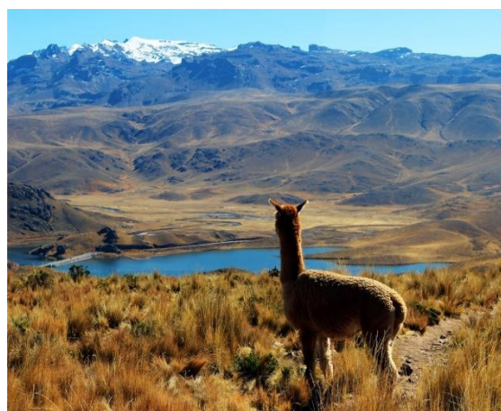
Αλπάκα στενίζει λίμνη στο βόρειο Περού