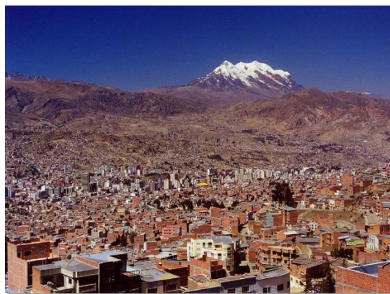
Λα Παζ, η πρωτεύουσα της Βολι-