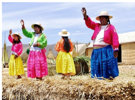
Στη λίμνη Τιπικάκα