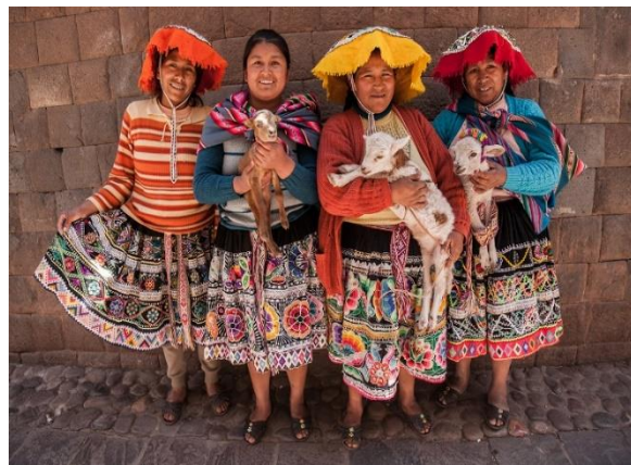
Γυναίκες με παραδοσιακές φορεσιές