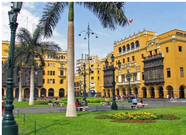
Λίμα, η πρωτεύουσα του Περού

Σήμερα θα κατευθυνθούμε στο Παράκας και από εκεί θα αναχωρήσουμε με ταχύπλοο για μια δώωρη κρουαζιέρα στον υδροβιότοπο Μπαγιέστας, έναν επίγειο παράδεισο για πουλιά και θαλάσσιους λέοντες. Μία σειρά από άγριες, απρόσιτες και φυσικά ακατοίκητες βραχονησίδες αποτελούν τον υδροβιότοπο αυτό, ο οποίος φιλοξενεί χιλιάδες θαλασσοπούλια, όπως γλάρους, πελεκάνους, κορμοράνους κλπ., εκατοντάδες θαλάσσιους λέοντες και αμέτρητα καβούρια, αστερίες, πεταλίδες κλπ. Το θέαμα