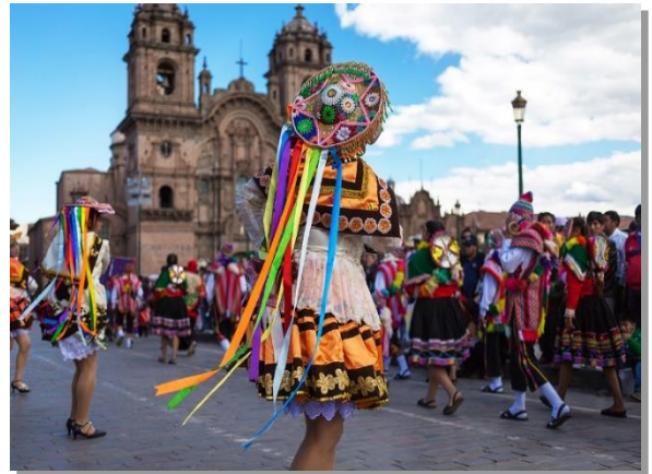
Παραδοσιακοί χοροί στο Κούσκο

Η σημαντικότερη ανάμνηση του ταξιδιού μας θα είναι σε λίγες ώρες πραγματικότητα. Αφού πραγματοποιήσουμε μία διαδρομή με πούλμαν, επιβιβασόμαστε στο τραίνο που τρέχει παράλληλα με τον Ιερό ποταμό κατά μήκος της Ιερής Κοιλιάδας, μέχρι την περιοχή ΆγουαςΚαλιέντες (Aguas Calientes – Θερμά Νερά). Από εδώ επιβιβαστούμε σε άλλο πούλμαν, που θα μας φέρει στην είσοδο του αρχαιολογικού χώρου του Μάτσου Πίτσου. Οι λέξεις είναι φτωχές να πουν και οι φωτογραφικές μηχανές να αποτυπώσουν τη μαγεία που μόνο η ψυχή μπορεί να δει. Φωτισμένα μυαλά επέλεξαν τον χώρο στην άκρη της ιερής κοιλάδας για να χτίσουν την ιερή πόλη των Ίνκας, που εγκαταλείφθηκε λίγο πριν μπουν οι Ισπανοί στην αυτοκρατορία, διατηρώντας έτσι την απόλυτη μυσικότητά της μέχρι το 1911, όταν την ανακάλυψε ο Χάιραμ Μπίνγκαμ. Ένα σύνολο από σιωπηλά πέτρινα ερείπια ναών, ανακτόρων, σπιτιών, υδραγωγείων και πύργων, θεμελιωμένων στην κάθετη ορθοπλαγιά, μαρτυρούν το μεγαλείο ενός μοναδικού πολιτισμού. Απολαύστε τη μαγεία του τοπίου και γνωρίστε την ιστορία της πόλης από τον έμπειρο ξεναγό μας. Η επιστροφή μας στο Κούσκο με τα ίδια συγκοινωνιακά μέσα, είναι ίσως ο καλύτερος τρόπος για να καταλαγιάσουν στο νου και στην καρδιά μας όσα είδαμε και μάθαμε σήμερα, όσα