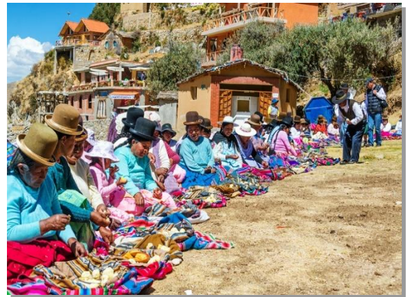
Τοπική λαϊκή αγορά στο Περού