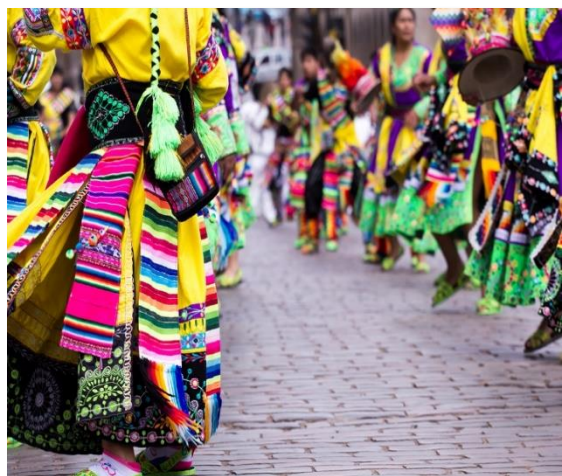
Χορευτές σε γιορτή στο Κούσκο