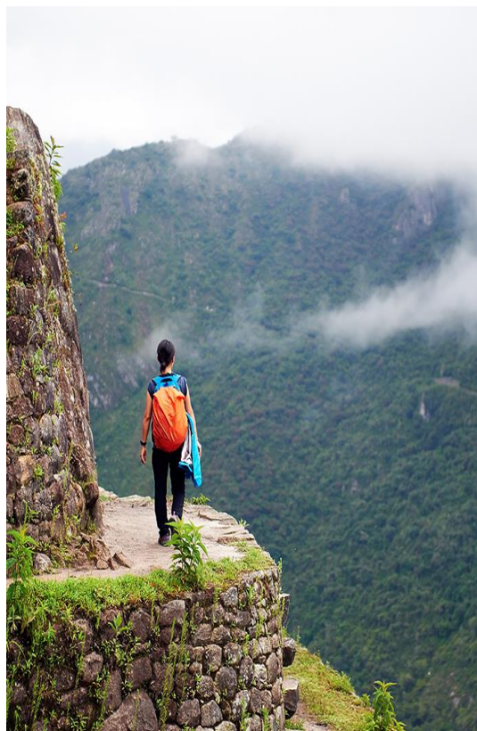
Περπατώντας πάνω απ' τα σύννεφα, στο Μάτσου Πίτσου