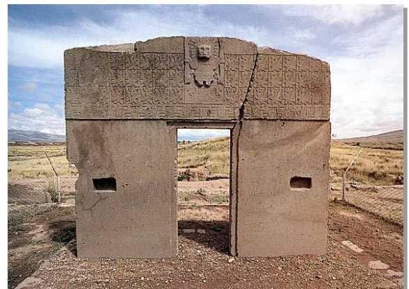
Η Πύλη του Ήλιου