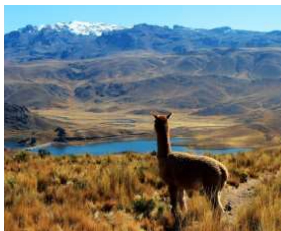
Αλπάκα ατενίζει λίμνη στο βόρειο Περού