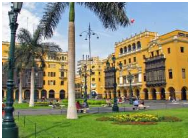
Λίμα, η πρωτεύουσα του Περού

Σήμερα θα κατευθυνθούμε στο Παράκας και από εκεί θα αναχωρήσουμε με ταχύπλοο για μια δώρη κρουαζιέρα στον υδροβιότοπο Μπαγιέστας, έναν επίγειο παράδεισο για πουλιά και θαλάσσιους λέοντες. Μία σειρά από άγριες, απρόσιτες και φυσικά ακατοίκητες βραχονησίδες αποτελούν τον υδροβιότοπο αυτό, ο οποίος φιλοξενεί χιλιάδες θαλασσοπούλια, όπως γλάρους, πελεκάνους,