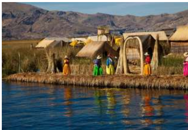
Στη λίμνη Τιτικάκα