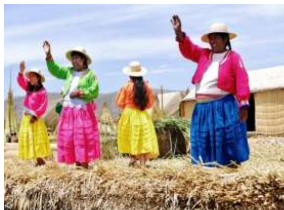
Στη λίμνη Τιπικάκα