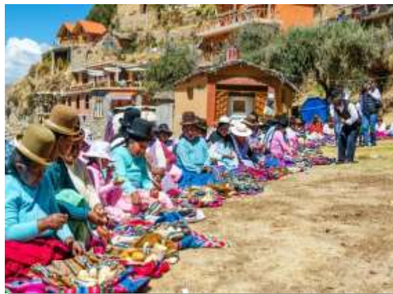
Τοπική λαϊκή αγορά στο Περού