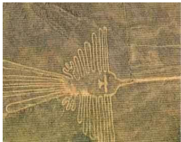
Στο οροπέδιο της Νάσκα