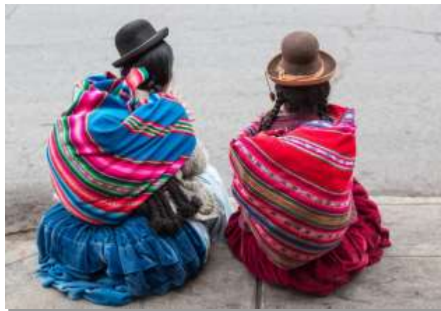
Γυναίκες με παραδοσιακές ενδυμασίες στο Πούννο

Πρωινή επίσκεψη στη λίμνη Τιτικάκα. Σε υψόμετρο 3.814 m και καταλαμβάνοντας έκταση 8.560 km 2 , η Τιτικάκα είναι η «υψηλότερη» και μεγαλύτερη, πλωτή λίμνη στον κόσμο. Εκτείνεται ανάμεσα στο Περού και τη Βολιβία, και σύμφωνα με τον μύθο των Ίνκας, στο νησί του Ήλιου γεννήθηκε ο θεός του Ήλιου. Το πλοiάριο θα μας φέρει στα νησιά των Ούρος, που είναι φτιαγμένα από καλάμια τοτόρας και βρίσκονται στον κόλπο του Πούννο. Είναι πράγματι μοναδικό το φαινόμενο των πλωτών νησιών, δύο από τα οποία θα επισκεφθούμε για να δούμε πώς ζουν οι ιθαγενείς Ούρος, πώς πλέουν τα νησιά τους, πώς χτίζουν τα καλάμια σπίτια τους, πώς κυνηγούν, πώς ψαρεύουν κτλ. Εκστατικοί και εντυπωσιασμένοι επιστρέφουμε στο Πούννο. Στη συνέχεια αναχωρούμε για τα σύνορα. Αφού περάσουμε τις συνοριακές και τελωνιακές διατυπώσεις, μπαίνουμε στο έδαφος της Βολιβίας και οδεύουμε προς τον αρχαιολογικό χώρο του Τιβανάκου ή Τιαχουανάκο, που στη γλώσσα Αϊμάρα σημαίνει "κατοικία των θεών". Ο εντυπωσιακός αυτός πολιτισμός αναπτύχθηκε από το 1500 π.Χ. μέχρι το 1200 μ.Χ., με λαμπρά επιτεύγματα στο ενεργητικό του, όπως η καθιέρωση του σεληνιακού και ηλιακού ημερολογίου, ο χωρισμός του χρόνου σε 365,24 ημέρες σύμφωνα με το ηλιακό ημερολόγιο, ο προσδιορισμός του αστερισμού του "Σταυρού του Νότου", η διατύπωση και καθιέρωση της θεωρίας «Τιαουανάκο» κλπ. Η επίσκεψή μας περιλαμβάνει το «λιθικό μουσείο», το αρχαιολογικό μουσείο και τις ανασκαφές στον αρχαιολογικό χώρο, όπου βρίσκεται το σημαντικότερο μνημείο