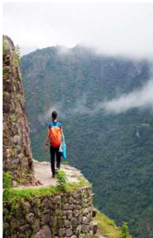
Περπατώντας πάνω απ' τα σύννεφα, στο Μάτσου Πίτσου

Το παραπάνω πρόγραμμα είναι ενδεικτικό. Το τελικό ενημερωτικό αποστέλλεται περίπου 3-5 ημέρες πριν από την εκάστοτε αναχώρηση.