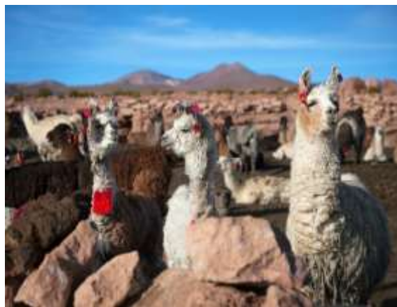
Λάμα, σήμα-κατατεθέν του Περού

Διαδρομή πολυποίκιλη η σημερινή, με τοπία άγριας ομορφιάς συνεχώς εναλλασσόμενα και με το εντυπωσιακό υψόμετρο των 4.335 m στη Λα Ράγια, στα σύνορα ακριβώς των δυο νομών. Στη διαδρομή μας θα επισκεφθούμε το Σιγουστάνι, τη νεκρόπολη των Κόγιας και των Ίνκας, οι οποίοι επέλεξαν τον χώρο αυτό για να θάβουν τους υψηλούς νεκρούς τους. Θα ξαναγηθούμε στη νεκρόπολη, θα δούμε τον τρόπο ταφής των νεκρών, αλλά και τον τρόπο χτισίματος των ταφικών μνημείων. Επίσης, θα σταματήσουμε στο σπίτι ενός ιθαγενούς της κοινότητας των Κόγιας, για να δούμε από κοντά τον παραδοσιακό τρόπο ζωής των ιθαγενών του υψιπέδου του Περού. Συνεχίζοντας φθάνουμε στο Κούσκο, που το όνομά του σημαίνει «Ομφαλός της Γης». Για τον ιστορικό, τον αρχαιολόγο, τον κοινωνιολόγο, τον εθνολόγο, τον καλλιτέχνη, το φωτογράφο και τον