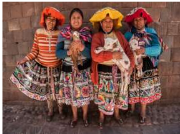
Γυναίκες με παραδοσιακές φορεσιές