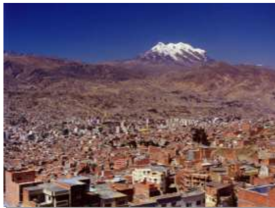
Λα Παζ, η πρωτεύουσα της