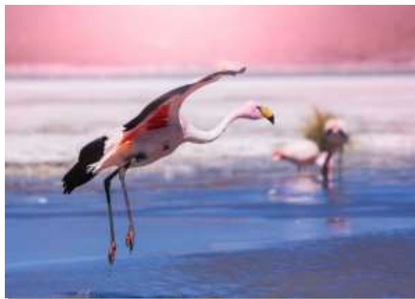
Θαλασσοπούλια στο Μπαγιέστας