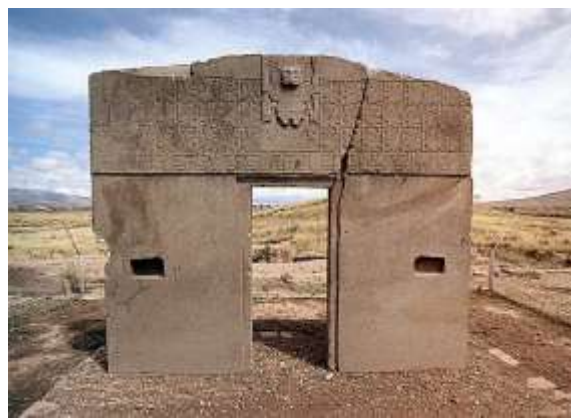
Η Πύλη του Ήλιου