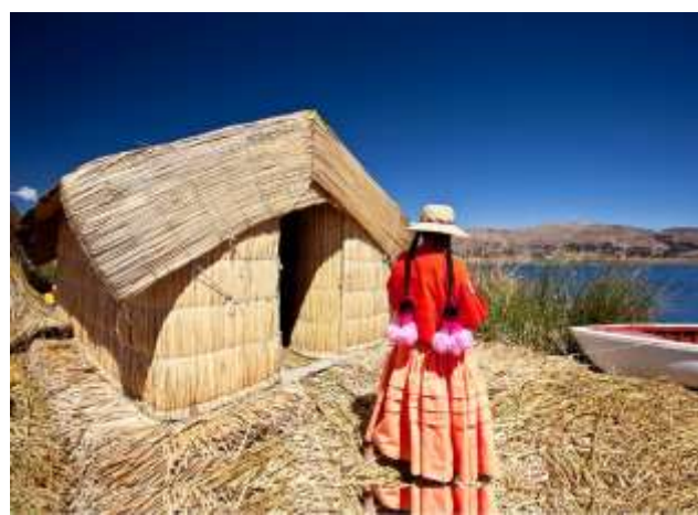
Νησιά Ούρος, λίμνη Τιτικάκα