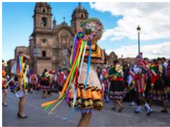
Παραδοσιακοί χοροί στο Κούσκο

Η σημαντικότερη ανάμνηση του ταξιδιού μας θα είναι σε λίγες ώρες πραγματικότητα. Αφού πραγματοποιήσουμε μία διαδρομή με πούλμαν, επιβιβαστούμε στο τραίνο που τρέχει παράλληλα με τον Ιερό ποταμό κατά μήκος της Ιερής Κοιλιάδας, μέχρι την περιοχή ΆγουαςΚαλιέντες (Aguas Calientes - Θερμά Νερά). Από εδώ επιβιβαστούμε σε άλλο πούλμαν, που θα μας φέρει στην είσοδο του αρχαιολογικού χώρου του Μάτσου Πίτσου. Οι λέξεις είναι φτωχές να πουν και οι φωτογραφικές μηχανές να αποτυπώσουν τη μαγεία που μόνο η ψυχή μπορεί να δει. Φωτισμένα μυαλά επέλεξαν τον χώρο στην άκρη της ιερής κοιλάδας για να χτίσουν την ιερή πόλη των Ίνκας, που εγκαταλείφθηκε λίγο πριν μπουκν οι Ισπανοί στην αυτοκρατορία, διατηρώντας έτσι την απόλυτη μυστικότητα της μέχρι το 1911, όταν