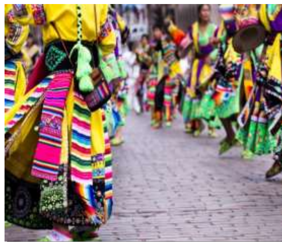
Χορευτές σε γιορτή στο Κούσκο