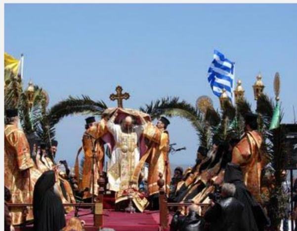
Τελετή του Νιπτήρος