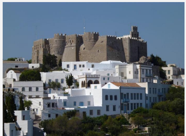
Ιερά Μονή Θεολόγου