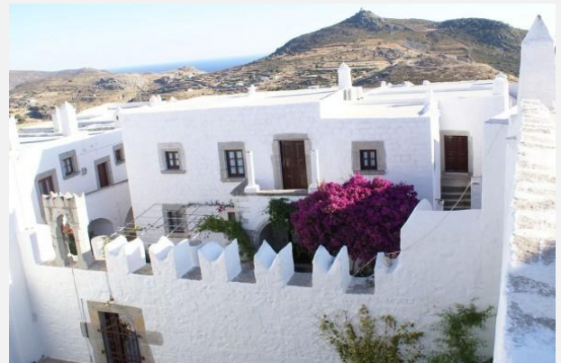
Μοναστήρι Ζωοδόχου Πηγής