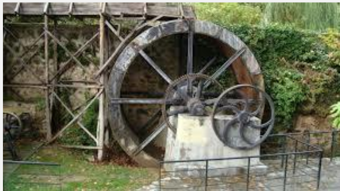
Υπαιθριο Μουσείο Νερού