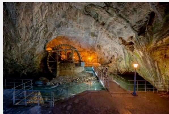
Σπήλαιο Πηγών Αγγίτη Ποταμού