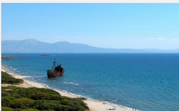
Ναυάγιο στο Βαλτάκι, Γύθειο