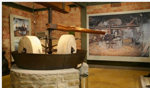
Μουσείο Ελιάς και Ελληνικού Λαδιού, Σπάρτη