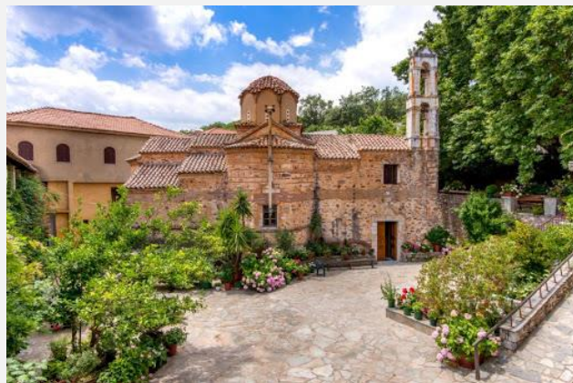
Ιερά Μονή Ζερμπίτσης

Σημαντική σημείωση: Απαγορεύεται αυστηρά η αποκόλληση πετρωμάτων εκ του Σπηλαιίου. Κάθε τέτοια