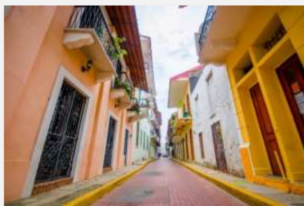
Η Παλιά Πόλη του Παναμά