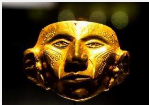
Στο Μουσείο Χρυσού , Μπογκοτά