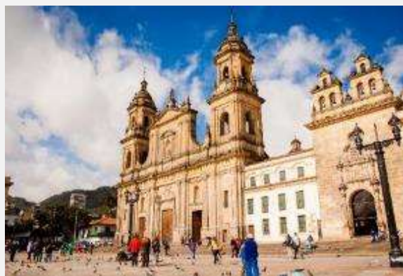
Ο καθεδρικός ναός στην πλατεία Μπολίβαρ

Η ξενάγηση συνεχίζεται στο ιστορικό κέντρο, τη λεγόμενη Καντελαρία . Κατ' αρχάς πρέπει να πούμε ότι όλο το ιστορικό κέντρο θεωρείται εξαιρετικό δείγμα της ισπανικής αποικιακής αρχιτεκτονικής. Εκεί βρίσκεται η Μεγάλη Πλατεία της Καντελαρίας, η Πλατεία Μπολίβαρ με το μεγαλειώδες άγαλμα του απελευθερωτή της Λατινικής Αμερικής. Στα χρόνια της ισπανικής αποικιοκρατίας (16ος-19ος αιώνας) η Μεγάλη Πλατεία εξυπηρετούσε στρατιωτικούς σκοπούς, λειτουργούσε ως μεγάλη αγορά και επίσης διέθετε αρένα για ταυρομαχίες. Και