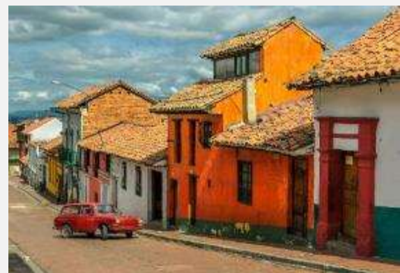
Έντονο το παραδοσιακό χρώμα στην Καντελαρία