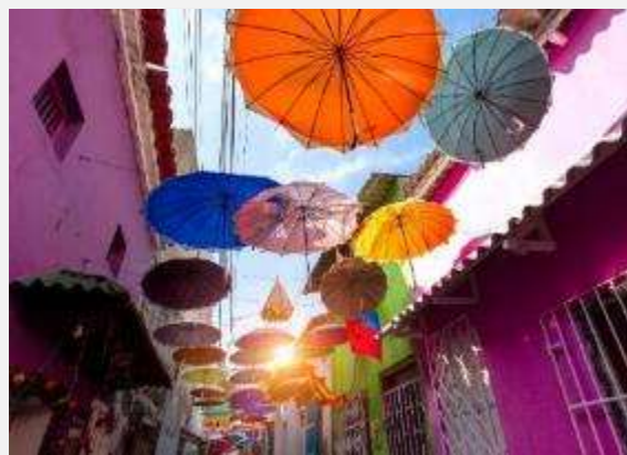
Στη συνοικία Γκετσεμάνι , στην Καρθαγίνη

Σήμερα θα αφήσουμε για λίγο πίσω μας την Καρθαγίνη και θα ταξιδέψουμε (περίπου 20 λεπτά) μέχρι το κοντινό ψαροχώρι Λα Μποκουίλα , όπου θα έχουμε την ευκαιρία να γνωρίσουμε την τοπική κουλτούρα αλλά και να γίνουμε ένα με το πλούσιο φυσικό τοπίο. Πρόκειται για ένα μέρος με σπουδαία ιστορία, όπου θα γνωρίσουμε την αφρικανική κοινότητα, η οποία έχει επενδύσει στη διάσωση και τη διατήρηση των πολιτιστικών παραδόσεων της αφρικανικής κληρονομιάς της. Μόλις φτάσουμε θα ξεκινήσουμε αμέσως για μια βόλτα με κανό στη λίμνη Ciénaga de Juan Polo, για να γνωρίσουμε το πλούσιο οικοσύστημα στο μαγκρόβιο δάσος που την περιβάλλει