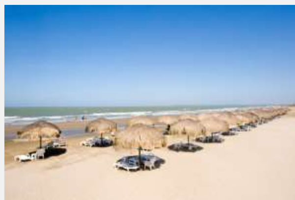
Η παραλία της Λα Μποκουίλα