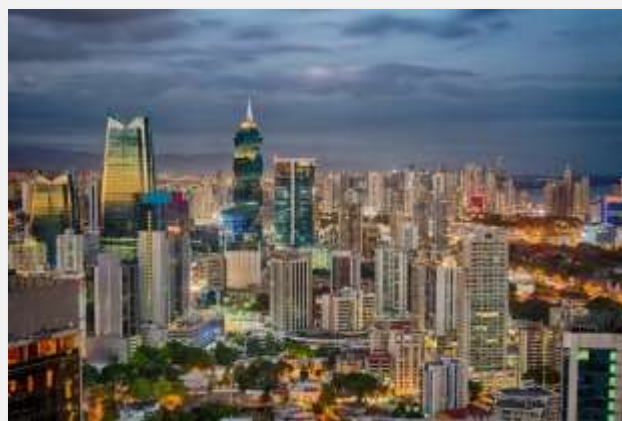
Η σύγχρονη όψη της πόλης του Παναμά που της έχει χαρίσει και το προσωνύμιο «το Χονγκ Κονγκ της Κεντρικής Αμερικής»

Τέλος, θα φτάσουμε στο σημείο θέασης του Μιραφλόρες , ιδανικό για να παρατηρήσουμε την κίνηση των πλοίων στην περίφημη Διώρυγα του Παναμά . Η Διώρυγα αποτελεί το υγρό μονοπάτι που χώρισε στη μέση μία ήπειρο για να ενώσει τους δύο ωκεανούς, τον Ατλαντικό και τον Ειρηνικό, και άλλαξε για πάντα το τοπίο της παγκόσμιας ναυσιπλοΐας και του εμπορίου.