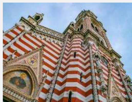
Χαρακτηριστικό δείγμα εκκλησιαστικής αρχιτεκτονικής στην Μπογκοτά