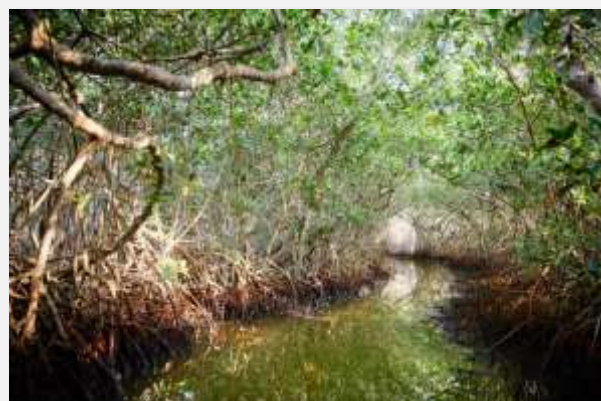
Τα μαγκρόβια δέντρα στη Λα Μποκουίλα