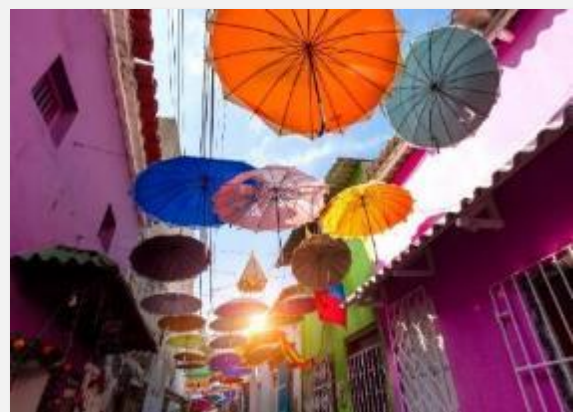
Στη συνοικία Γκετσεμάνι , στην Καρθαγένη