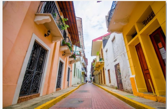
Η Παλιά Πόλη του Παναμά...