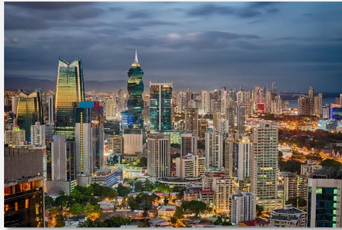
Η σύγχρονη όψη της πόλης του Παναμά που της έχει χαρίσει και το προσωνύμιο «το Χονγκ Κονγκ της Κεντρικής Αμερικής»

Τέλος, θα φτάσουμε στο σημείο θέασης του Μιραφλόρες , ιδανικό για να παρατηρήσουμε την κίνηση των πλοίων στην περίφημη Διώρυγα του