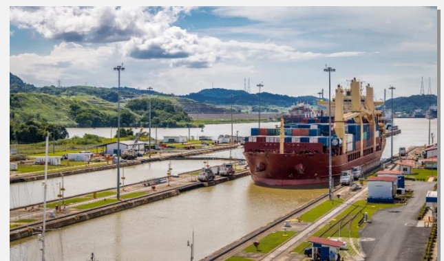
Στη Διώρυγα του Παναμά