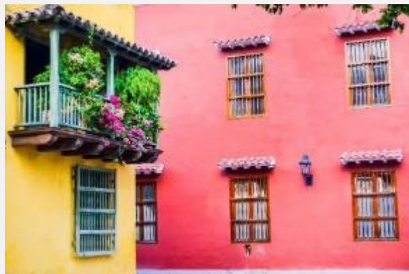
Η Καρθαγένη είναι σίγουρα η πόλη με τα χίλια χρώματα

Σήμερα θα αρχίσουμε την ξενάγησή μας απολαμβάνοντας μια πανοραμική θέα της πόλης από την εκκλησία και μοναστήρι La Pora , γνωστό και ως Pora del Galeon, το οποίο φημίζεται ότι μοιάζει με την πρύμνη γαλέρας. Κατασκευάστηκε το 1606 και από εκεί μπορεί κανείς να δει μέχρι και το λιμάνι της Καρθαγένης, ένα από τα σημαντικότερα της Καραϊβικής. Στη συνέχεια θα περάσουμε στο φρούριο Σαν Φελίπε Λόπες , το οποίο έλαβε αυτή την ονομασία προς τιμήν του ντόπιου ποιητή Δον Λουίς Κάρλος Λόπες (1883-1950), που θεωρείται εμβληματικός για τη Λατινική Αμερική και έγραψε το διάσημο σονέτο με τίτλο: «Για την γενέτειρά μου». Η σημασία αυτού του ποιητή για τη λατινοαμερικανική λογοτεχνία είναι μεγάλη διότι, σύμφωνα με τους κριτικούς, περιέγραψε