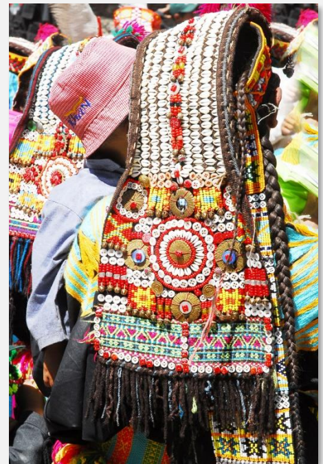
Χαρακτηριστική φορεσιά των Καλάς