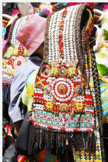
Χαρακτηριστική φορεσιά των Καλάς