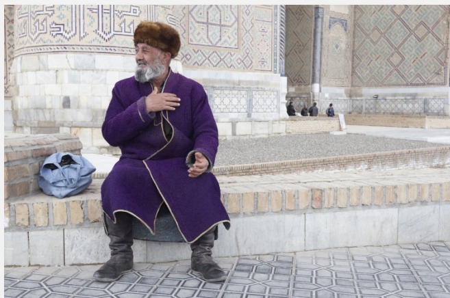
Ουζμπέκος με παραδοσιακή φορεσιά

Η Τασκένδη , πόλη με λειτουργική ρυμοτομία, μοντέρνα κτίρια, χαρακτηριστική άνεση χώρων και αρκετό πράσινο αποτελεί σήμερα το μητροπολιτικό κέντρο της Κεντρικής Ασίας. Η ψυχή της πόλης κτυπά σε ήρεμους ρυθμούς στα περιποιημένα πάρκα και στις πλατείες με τα εντυπωσιακά σιντριβάνια και αγάλματα, ενώ οι πυκνές δεντροστοιχίες που διατρέχουν τις κεντρικότερες λεωφόρους της πόλης χαρίζουν αφειδώς μια πράσινη υπερχειλίζουσα ομορφιά. Είναι επίσης μία από τις αρχαιότερες όσο και μεγαλύτερες πόλεις της Κεντρικής Ασίας, και η