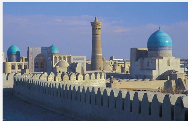
Παραδοσιακή αρχιτεκτονική στο Ουζμπεκιστάν