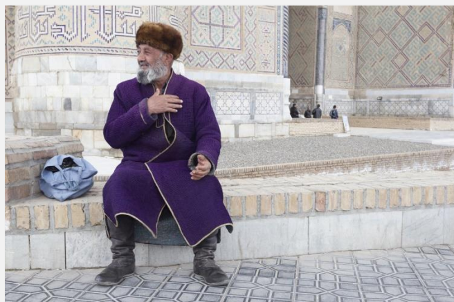
Ουζμπέκος με παραδοσιακή φορεσιά