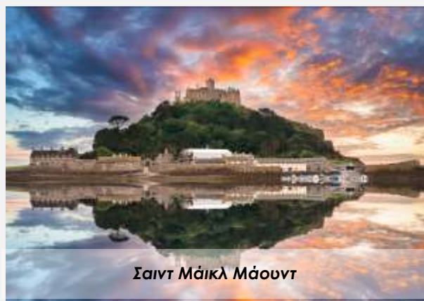
Σαιντ Μάικλ Μάουντ