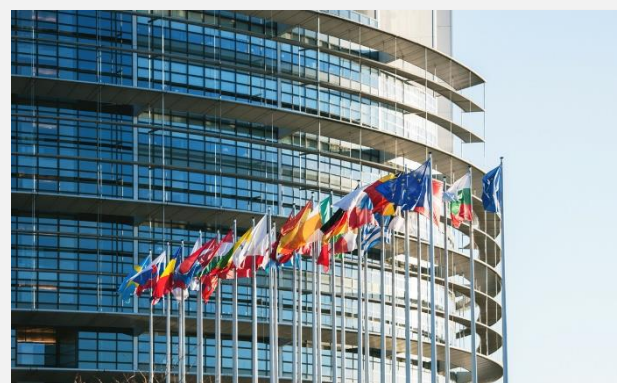
Έξω από το κτίριο του Ευρωπαϊκού Κοινοβουλίου, στο Στρασβούργο