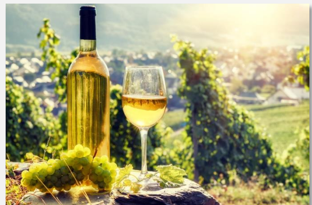
Στους μεθυστικούς δρόμους του κρασιού της Αλσατίας