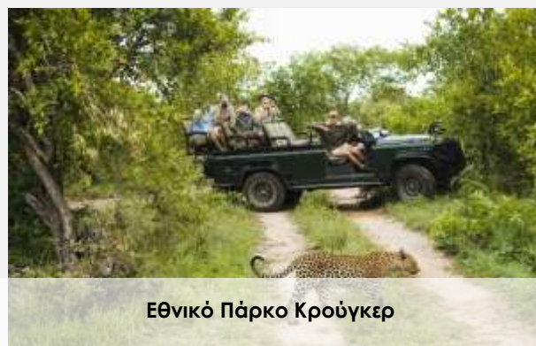
Εθνικό Πάρκο Κρούγκερ

Στη συνέχεια της ημέρας ξεκινάμε να γνωρίσουμε την πόλη του Κέιπ Τάουν. Μία πόλη στην άκρη μιας ηπείρου δεν σημαίνει πάντα πως είναι μια ξεχασμένη πόλη. Στην περίπτωση μάλιστα του Κέιπ Τάουν συμβαίνει ακριβώς το αντίθετο. Κοσμοπολίτικο, γεμάτο ζωή και χρώματα, το Κέιπ Τάουν και η ευρύτερη περιοχή του Ακρωτηρίου συνδυάζουν την ιστορία με το μέλλον του τόπου.