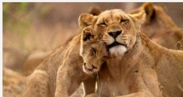
Εθνικό Πάρκο Κρούγκερ

Ξεκινάμε την ημέρα μας με ακόμα ένα σαφάρι με 4x4 στο Εθνικό Πάρκο Κρούγκερ, μία ευκαιρία ακόμη για να δούμε από κοντά τον πλούτο του Πάρκου και τους «αυθεντικούς κατοίκους» του. Οι ανεπανάληπτες εμπειρίες συνεχίζονται ακολουθώντας την διαδρομή Panorama που θα μας φέρει στα πιο εντυπωσιακά σημεία του