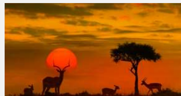
Εθνικό Πάρκο Κρούγκερ