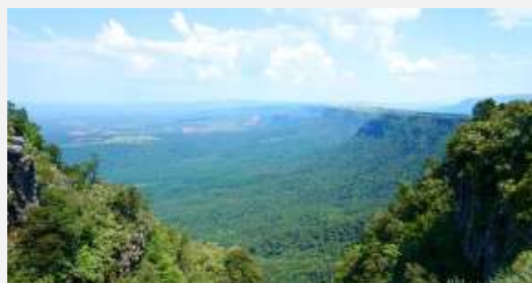
Το Παράθυρο του Θεού