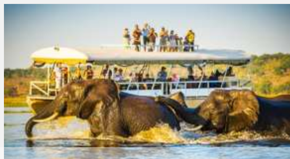
Εθνικό Πάρκο Τσόμπε / Μποτσουάνα