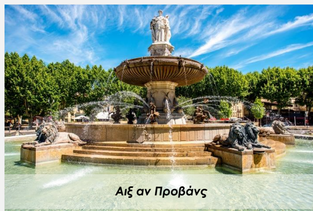
Αιξ αν Προβάνς