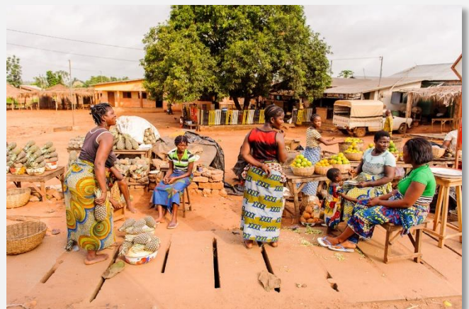
Αγορά στο Πόρτο Νόβο, Μπενίν