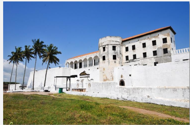
Κάστρο Ελμίνα, Γκάνα