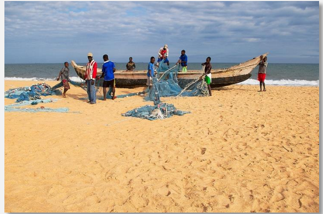
Ψαράδες στο Λομέ, Τόγκο

Ημέρα εντυπώσεων και συγκίνησης η σημερινή, αφού θα μας μεταφέρει στην απάνθρωπη εποχή του δουλεμπορίου. Η ακτή που βρισκόμαστε στον Κόλπο της Γουινέας, εκτός από το έντονο τροπικό της χρώμα έχει στο παρελθόν της μια πολύχρονη ιστορία δουλεμπορίου. Εδώ έφτασαν τον 16 ο αιώνα οι Ευρωπαίοι αναζητώντας χρυσό: από τα κάστρα που δεσποζούν κατά μήκος της ακτογραμμής της, αναδύεται το άρωμα της εποχής των Πορτογάλων, των Γάλλων, των Ολλανδών και των Βρετανών που τα κατασκεύασαν και στη συνέχεια επιδόθηκαν στην εκμετάλλευση των ιθαγενών, στέλνοντας караβάνια μαύρων στις αποικίες τους. Από τα εκατό περίπου κάστρα που βρίσκονται στην περιοχή, θα επισκεφθούμε αυτό του Κέιπ Κόουστ, το οποίο είχε κατασκευαστεί το 1653 και στο οποίο στεγάζεται από το 1994 το Ιστορικό Μουσείο Δυτικής Αφρικής καθώς και το Κάστρο Ελμίνα, γνωστό και ως Κάστρο Αγίου Γεωργίου, το οποίο είχε κατασκευαστεί το 1482 και αποτελεί το πρώτο Ευρωπαϊκό κτίριο της υποσαχάριας Αφρικής. Το λιμάνι με τις πολύχρωμες πλώγες προσφέρει μια από τις ωραιότερες σκηνές για φωτογραφίες στη Δυτική Αφρική. Στη συνέχεια θα εξερευνησουμε το Εθνικό Πάρκο Κακούμ, που εκτείνεται