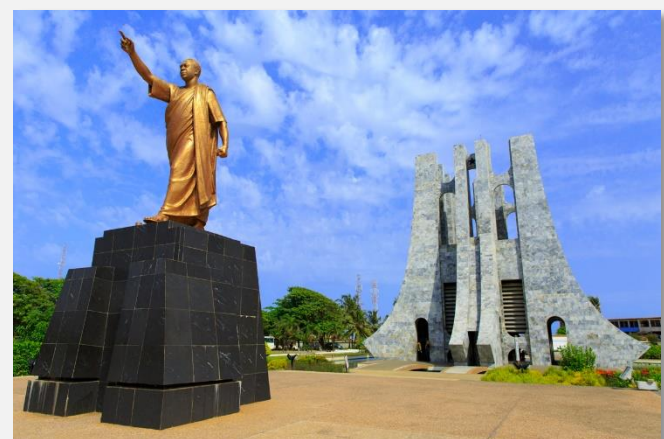
Μνημείο Νκρούμα, Άκκρα, Γκάνα