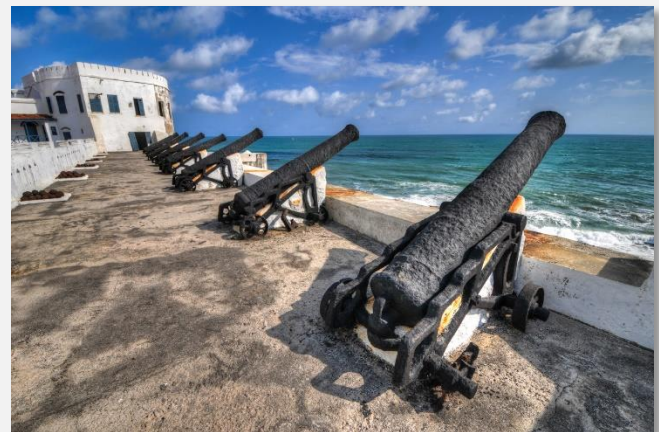
Cape Coast, Γκάνα