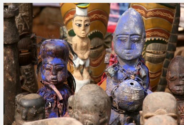
Ξυλόγλυπτες φιγούρες σε «φεστιβάλ βουντού», στο Ουιντάχ, Μπενίν